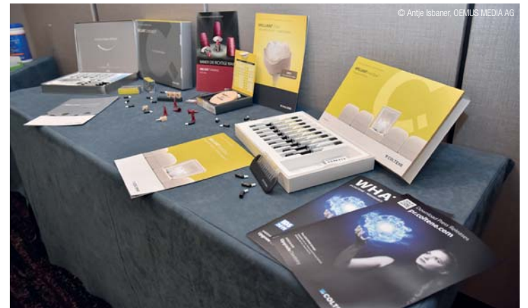
◀ COLTENE stellte das Composite Veneering-System BRILLIANT COMPONEER jetzt mit verbesserter Rezeptur vor. ◀ COLTENE presented the composite veneering system BRILLIANT COMPONEER with new, improved formula.

With BRILLIANT COMPONEER, COLTENE has further improved its leading composite veneering system. The material is based on the sub-micron filler technology of the already well-proven and effective composite BRILLIANT EverGlow, which makes it easy to polish. The glossy composite