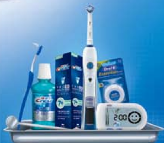
专业正畸口腔护理计划