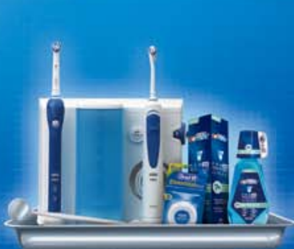
专业种植口腔护理计划