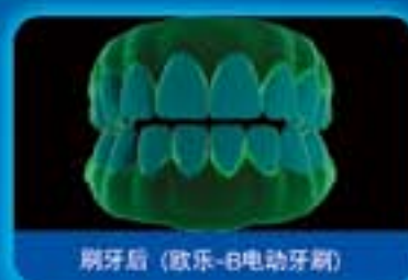
刷牙后 (欧乐-B电动牙刷)