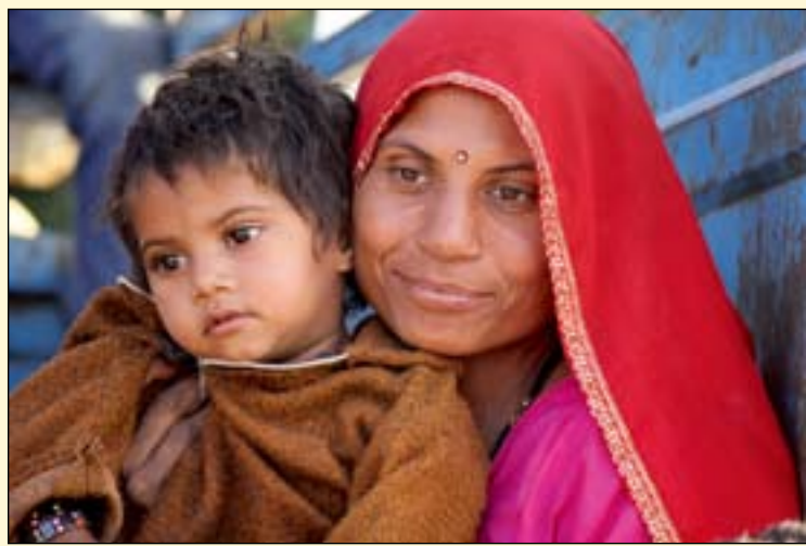
每年预计有数以亿计的新增病例产生从而增加负担

了没有及时治疗的龋齿问题的所有相关数据的系统性回顾。这是对所有国家, 出生于1990年到2010年之间的男性和女性分析后, 得到了一份关于龋