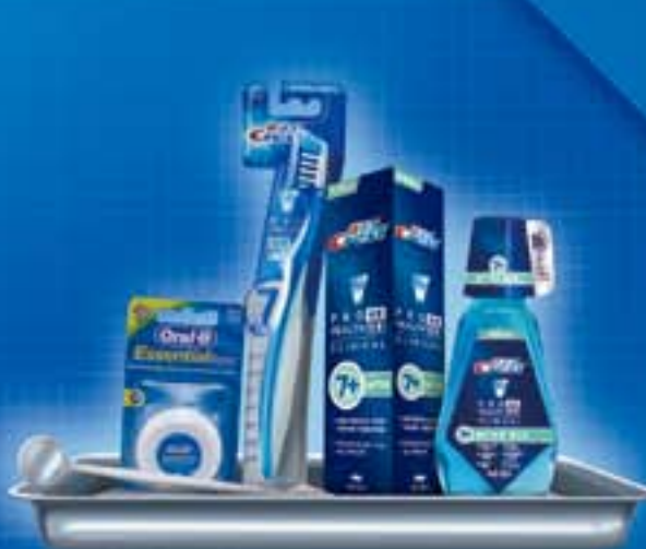
专业牙周口腔护理计划