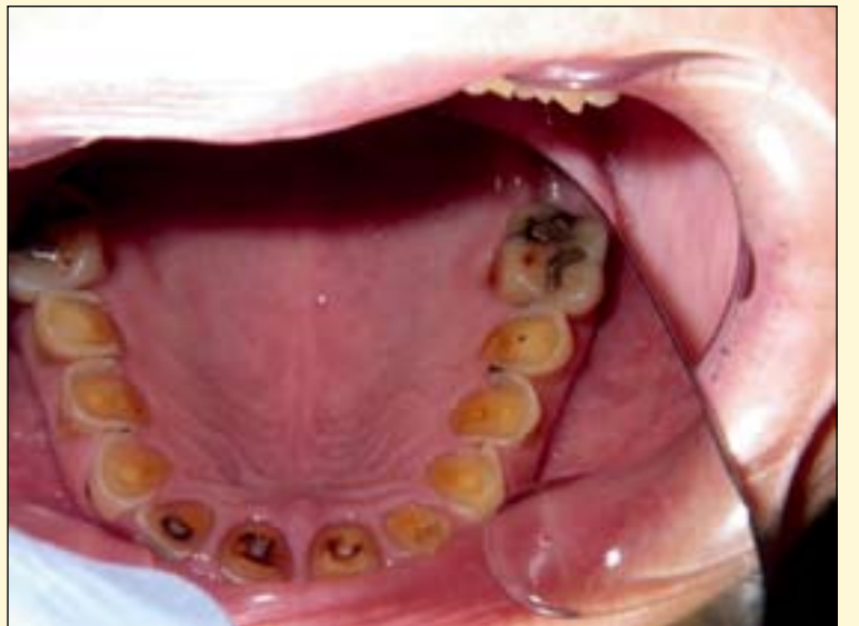
图1、2: 贪食症患者呕吐所致的严重的牙腐蚀。

消耗的食物，比如冰淇淋。随后引发抑郁、恐慌和内疚，并强迫将进食的食物清除掉。数月内每周至少发病两次。一些贪食症患者每天呕吐可达五到六次。大多数人因暴食症而死亡。