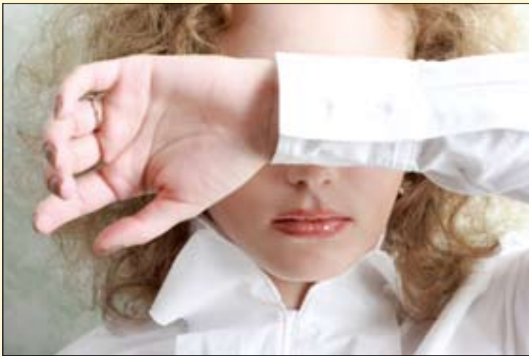
表2: 饮食失调症患者的精神症状