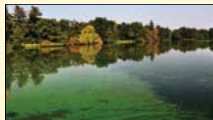
新的研究表明，藻类、真菌和细菌具有特别的性能。从科学和技术的角度来看，这都有助于改善结构模板的创建和牙科材料的发展。

继这篇论文之后，作为德国研究基金会（DFG）Reinhart Koselleck项目的一部分，科学家们已经在使用这项技术。利用红藻的特殊性质——从糖分子中分泌链；其运动方向取决于光照，科学家们投射光模式，转变为藻类的生长介质——利用它们来创建长而细的聚合物