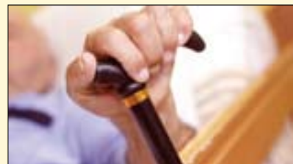
这项研究强调了老年人在一生中保持功能性牙列的重要性。

这项题为《牙齿数量、使用假牙和老年人肌肉骨骼脆弱性之间的联系》的研究发表于2017年12月7日的《老年人与老年病学国际》期刊。DT