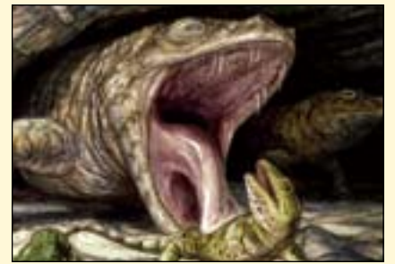
早期的二叠纪dissorophid Cacops显示了它可怕的牙列，图为它在捕食不幸的爬行动物Captorhinus。（插图：布莱恩·恩格/ dontmesswithdinosaurs.com）

丢失或分散。 小牙明显小于嘴边缘的牙齿，长度为几十到几百微米。“它们实际上是真正的牙齿，而不是这些四足动物口中的突出物。”Reisz解释道。“牙齿具有在嘴边的大牙齿的所有功能。在研究（大约）2.89亿年前的四足体标本时，我们发现小牙基本上具有被认为可以定义牙齿的所有主要特征，包括牙釉质和牙本质、牙髓腔和牙周炎。”他继续说道。 Reisz和他的研究生们认为，下一个大问题是关于牙齿整体丰度的进化变化：如果这些古代的两栖动物拥有惊人数量的牙齿，为什么大多数现代两栖动物会减少或完全失