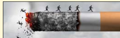
美国国会议员最近提出了一项旨在解决年轻人尼古丁上瘾问题的法案。

牙科联盟在信中指出, 这项立法将有助于防止美国青少年吸烟。此外, 根据2014年