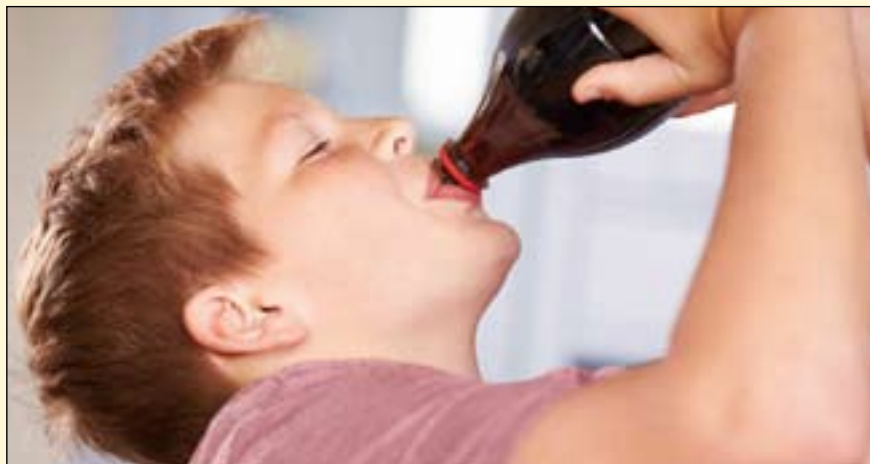
研究人员监测了3671名青少年每日饮用含糖饮料的情况, 发现那些饮用量高的人发生口腔健康问题的可能性是其他人的两到三倍。

该研究还报告了不同类型的含糖饮料和口腔健康影响之间的关系, 表明除了果汁以外, 所有饮料都与频繁的牙痛或不能进食