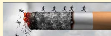
美国国会议员最近提出了一项旨在解决年轻人尼古丁上瘾问题的法案。

牙科联盟在信中指出, 这项立法将有助于防止美国青少年吸烟。此外, 根据2014年