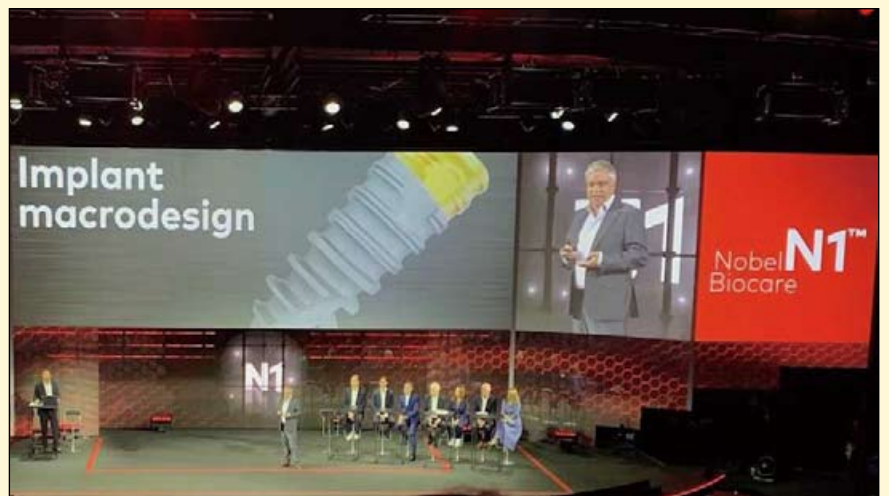
Nobel Biocare在西班牙举行的研讨会上展示了新的N1种植体系统。

这一新系统将很快向全世界牙科专业人员开放，旨在使治疗过程更快、更直接，治疗效果更加可预测。而实现这一目标需要挑