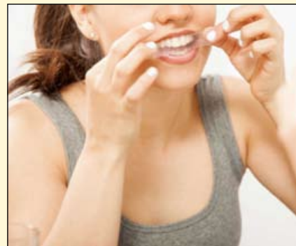
研究人员发现，在美白牙膏中发现的某种活性成分可能会损害富含蛋白质的牙本质。

本项研究的总结于2019年4月6日至4月10日在奥兰多美国生物化学和分子生物学会的年会上发表。DI