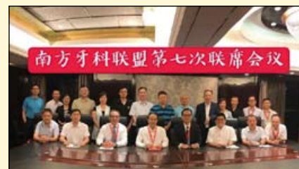
联盟第七次联席会议合影

泉州盛大开幕，共有3000多名医生、500多名嘉宾及代表团参加，以及厂商经销商等口腔医务工作者1000人左右，合计4500多人。创造了南方口腔医学大会最高人数及最大规模纪录。