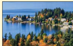
位于华盛顿湖畔的美丽小镇Kirkland。