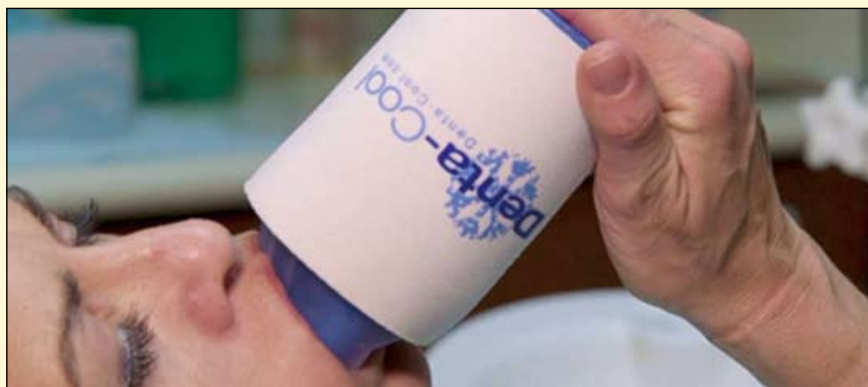
Denta Cool最近为牙科患者发布了一种非处方口内止痛剂, 可有效替代阿片类药物或冰袋。

药物, 而不是其他止痛药或医疗设备。然而, 根据各种研究, 尽管通常认为阿片类药物的使用是安全的, 但长期使用该类物质且剂量高于最初处方的患者可能会发展成阿片类药物成瘾、药物过量甚至死亡。美国国家药物滥用研究所报告说, 1999年至2017年, 在美国, 涉及类阿片的药物过量死亡人数增加了6倍, 从8048人增加到47600人。同期处方类阿片类药物死亡人数从3442人上升到17029人。