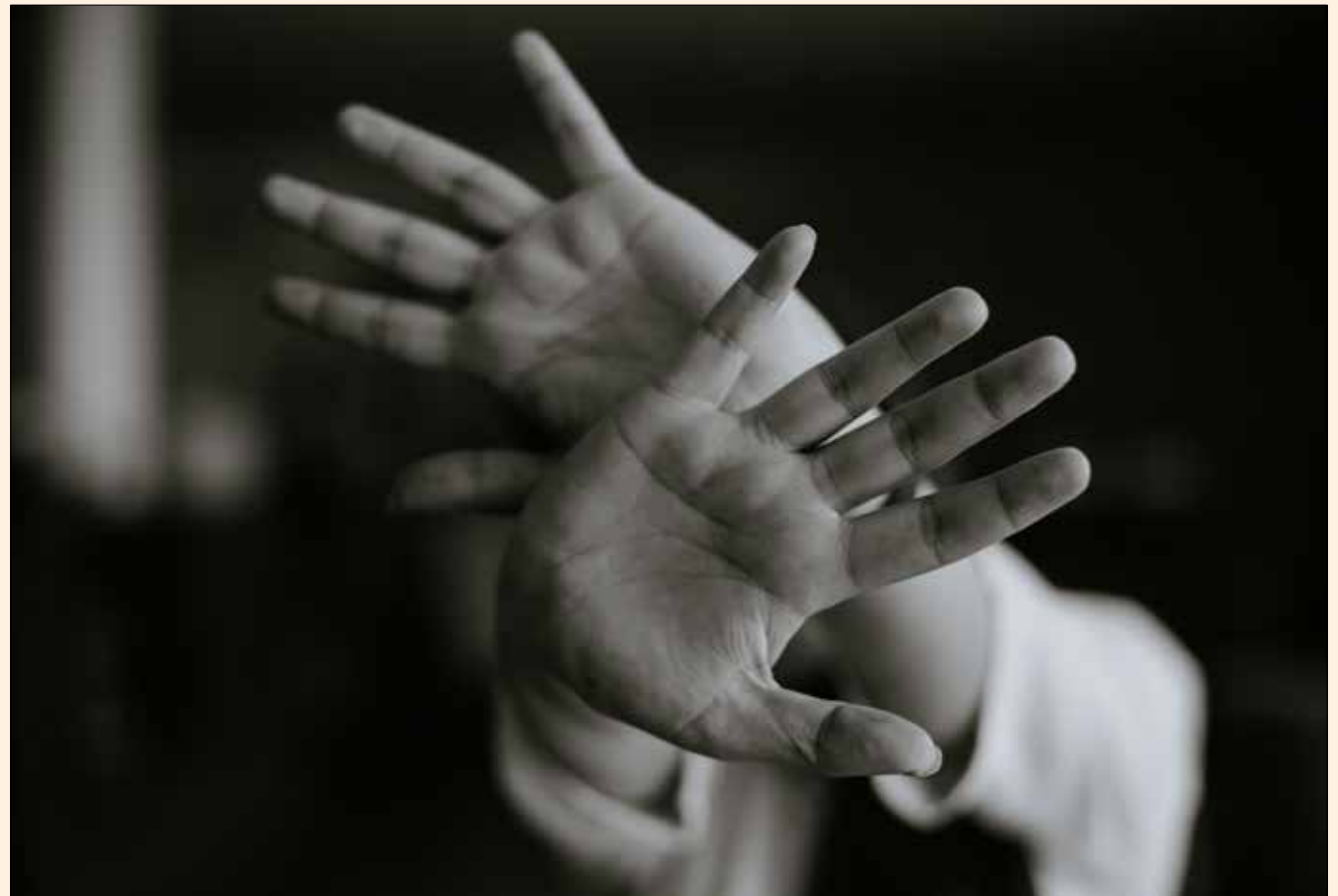
Lo primero que debemos hacer es identificar la razón de nuestro miedo, qué nos da ansiedad del dentista.

“Más que preocuparnos por si va a doler o no, debemos pensar en los beneficios que se van a obtener con el tratamiento”.