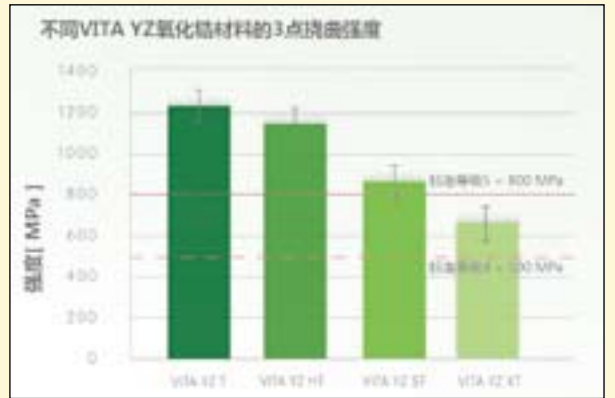
图6: 各类VITA YZ氧化锆材料的三点挠曲强度。

测试方法: 每个系统制作六组相同设计的后牙桥, 使用通用实验设备对其进行断裂载荷试验。