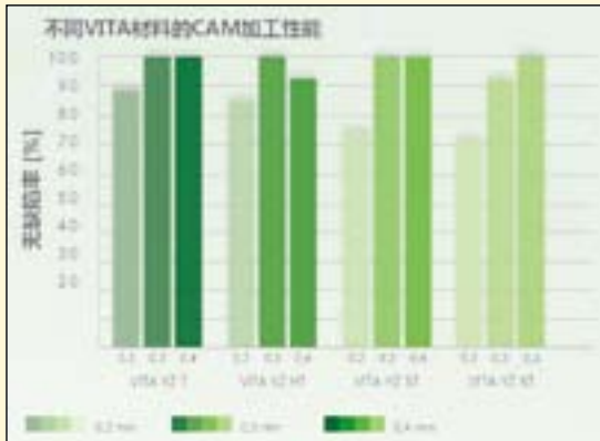
图4: 不同VITA YZ氧化锆材料的CAM加工性能。