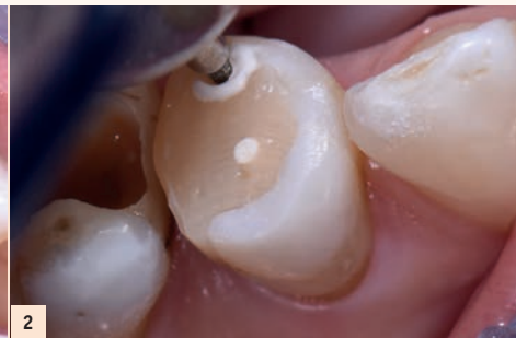
Fig. 2 : Préparer un veneerlay s'appuie sur les principes de préparation des overlays et des facettes. La présence des gages des fraises de pénétration contrôlée Deep Marker (Komet) permet une réduction calibrée, homothétique et graduelle des tissus dentaires mais aussi par rapport à la restauration finale.