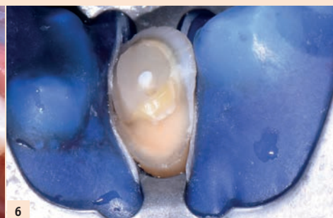
Fig. 6 : Le collage du ventrale doit être réalisé sous champ opératoire, la mise en place de torons facilitera le retrait des excès de colle.