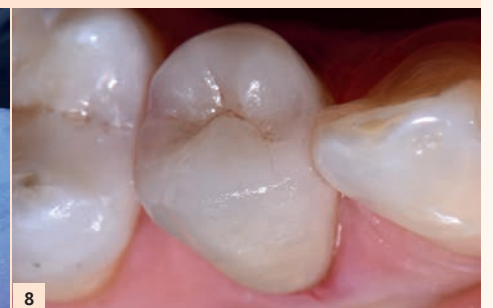
Fig. 8 : Résultat postopératoire immédiat : un réglage occlusal statique et dynamique est essentiel après l'étape du collage.