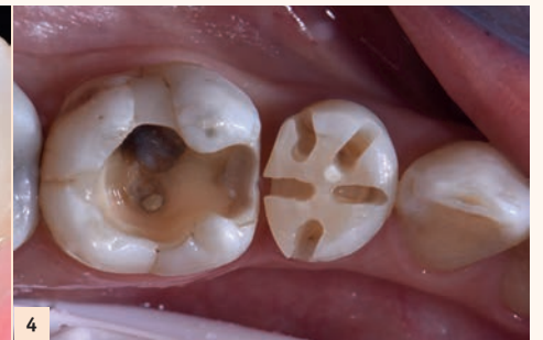
Fig. 4 : Ainsi, la table occlusale est réduite de 1,5 mm de hauteur, grâce aux fraises de pénétration contrôlée. Tous les sillons sont marqués afin d'obtenir une épaisseur régulière de préparation.