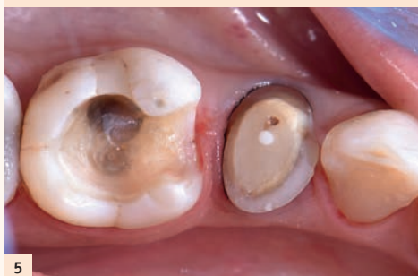
Fig. 5 : Ces rainures servent alors de repères pour la finition vestibulaire de la préparation.