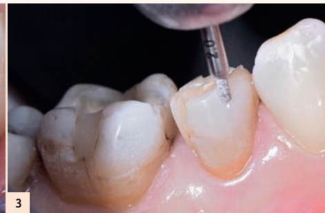
Fig. 3 : Cette manipulation assure un contrôle efficace de la profondeur de pénétration dans la dent (ou des mocks-up) afin de satisfaire au double principe de l'économie tissulaire maximale et de l'épaisseur minimale requise pour la restauration finale.