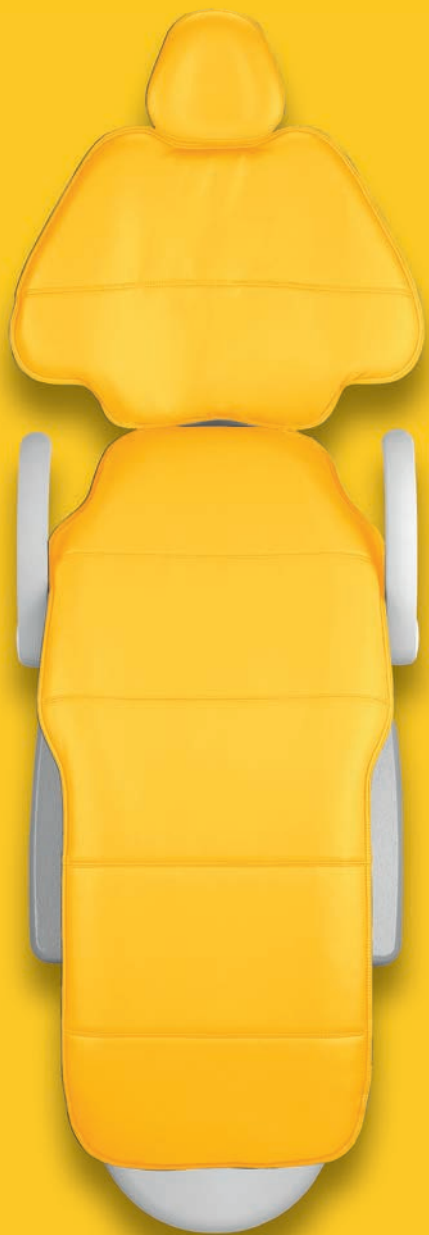
SASSY Color by A-dec