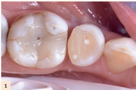
Fig. 1 : Voici l'exemple clinique d'une dent dépulpée (45) qui nécessite un recouvrement occlusal, mais également une restauration de la face vestibulaire.