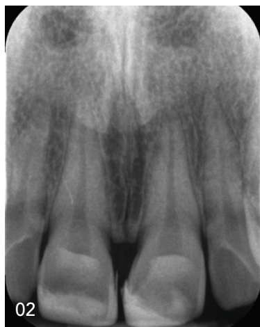
02 Einzelröntgenbild der Front, das Ausmaß der Füllungen wird hier ersichtlich.