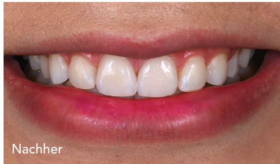
01 Vorher – nachher.

V ermehrt lässt sich leider immer wieder feststellen, dass ästhetische Behandlungen mit massiver Verletzung der Zahngesundheit durchgeführt werden. Für die Korrektur leichter Zahnfehlstellungen oder Zahnfarben werden die entsprechenden Zähne teilweise für Vollkronen zu dünnen Stümpfen präpariert. In diesem Beitrag soll gezeigt werden, wie eine Verbesserung der Ästhetik und die Wahrung der Zahngesundheit Hand in Hand gehen können. Defekt- und indikationsbezogen sollte genau abgewogen werden, wie die ästhetische Verbesserung minimalinvasiv erzielt werden kann.