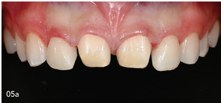
05a + 05b Zwischenstand nach Präparation und Flowable Injection Technique.

Intraoralscanner (Trios, 3Shape) erfasst und an das hauseigene Labor übermittelt (Abb. 6a und b).