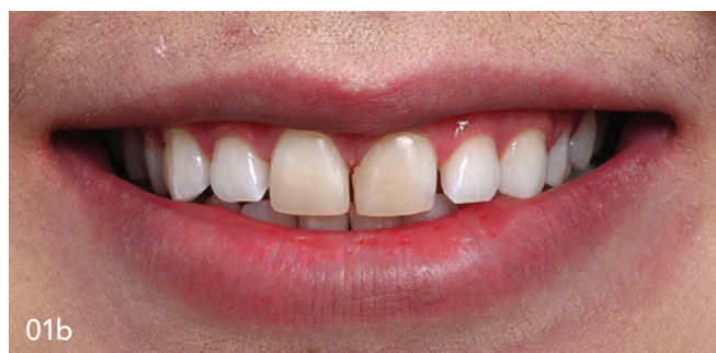
01a+01b Die Ausgangssituation.