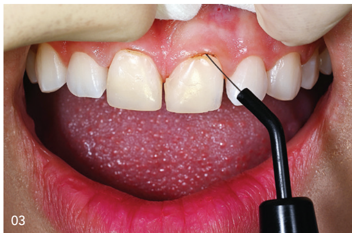
03 Zahnfleischharmonisierung mittels Elektrotom.