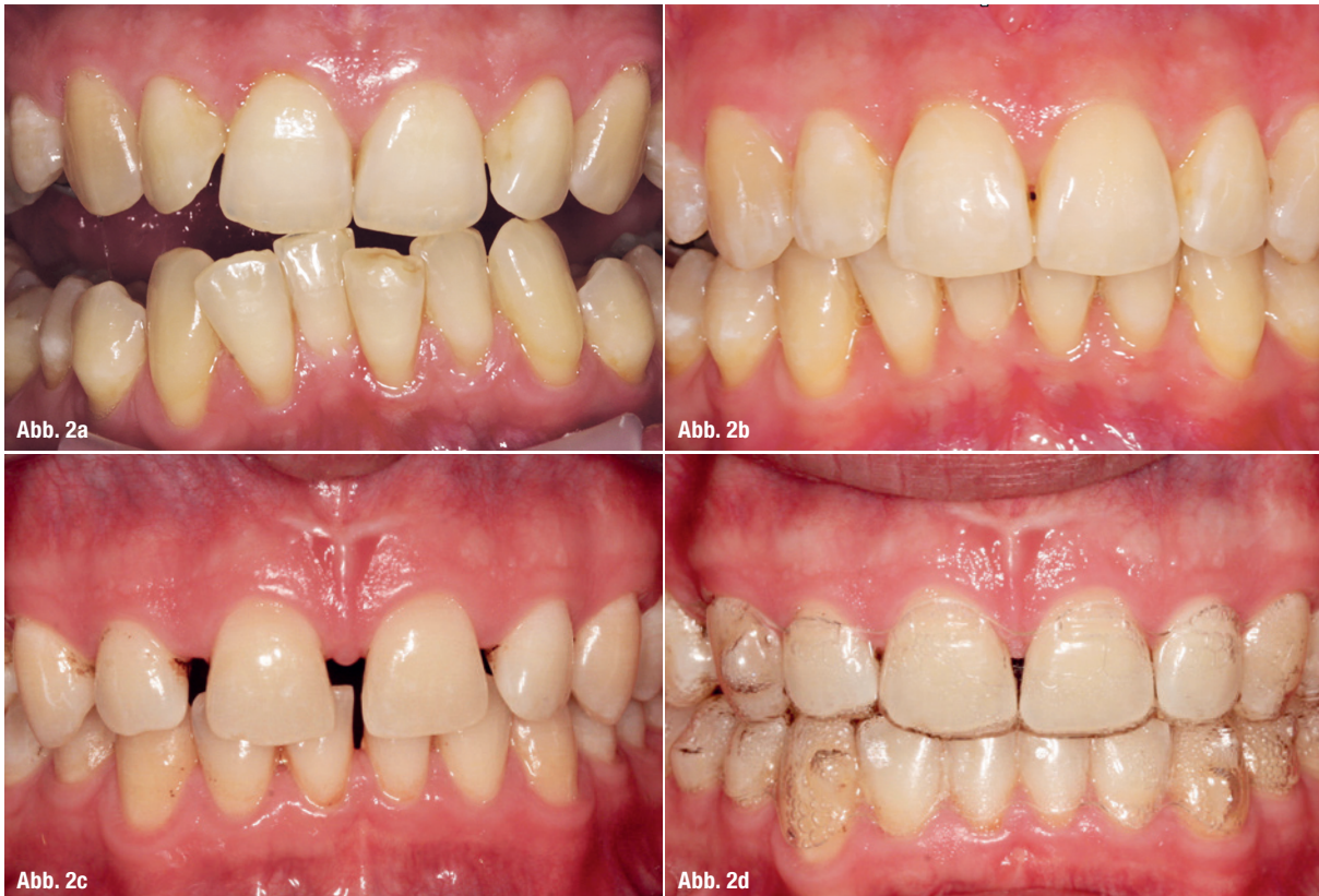
Abb. 2a–d: Darstellung von kieferorthopädischen Korrekturmöglichkeiten mit Multiband ( a und b ) und Invisalign ( c und d ).

werden. Die Implantologie ist schon lange nicht nur Oralchirurgen vorbehalten. Trends wie die Etablierung von kurzen Implantatsystemen haben sich erst durch intrinsische Evidenz von Generalisten und parodontologisch arbeitenden Zahnärzten wirklich richtig entwickeln können.