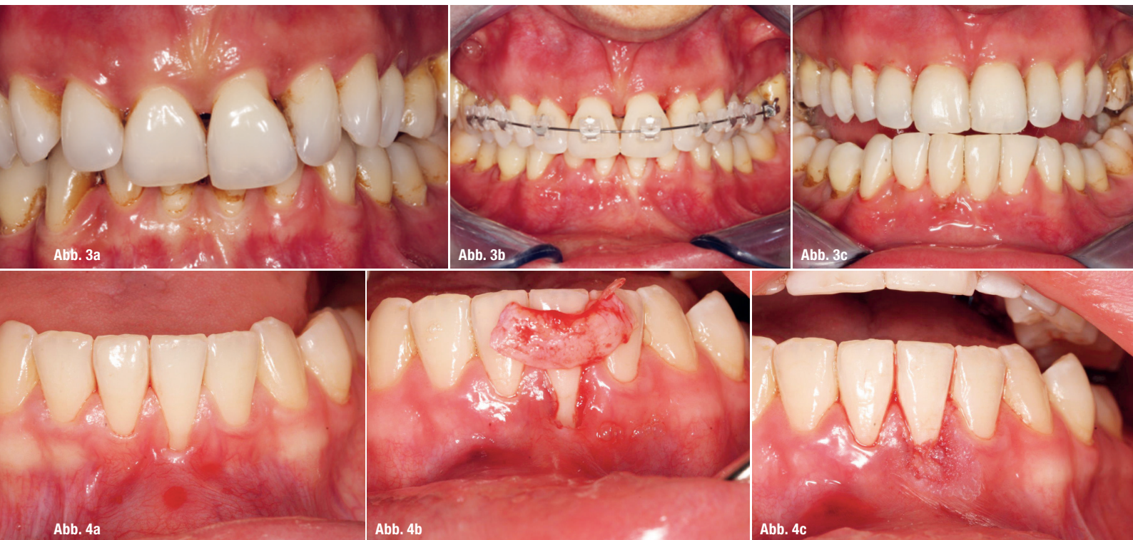
Abb. 3a–c: Kieferorthopädische Behandlung einer Parodontalpatientin mit anschließender Verbreiterung der Interdentalräume mittels Schichttechnik. Abb. 4a–c: Darstellung einer Kombinationsbehandlung bei einer Patientin mit behandelter aggressiver Parodontitis und daraus resultierender Zahnbewegung sowie Gingivaverlust. Die Patientin wurde parodontal, kieferorthopädisch und konservativ behandelt.

Nicht selten kommen die Patienten wegen Rotationen in die Praxis und erhalten Veneerversorgungen, die mit Zahnspangen hätten verhindert werden können. Auch wir oder besser gesagt besonders wir als Ästhetiker haben eine sehr große Verantwortung im Hinblick auf die Art der Versorgung, denn nicht selten sind kosmetische Eingriffe reine Wahleingriffe. Besteht die Möglichkeit einer Schonung der Zahnhartsubstanz durch eine kieferorthopädische Therapie, dann sollte diese Möglichkeit immer vorrangig durchgeführt werden. Zahlreiche ästhetisch-kosmetische Spezialisten sind heute in der Lage, diese Behandlungen ohne Weiteres selbst durchzuführen. Aus dem Portfolio eines Ästhetikers ist diese Art der Behandlung aus meiner Sicht ein Muss (Abb. 2 a–d).