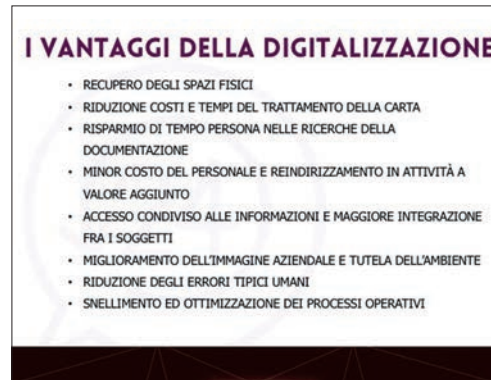
Fig. 2_ I vantaggi della digitalizzazione.

Colmare il gap tecnologico senza quello organizzativo significa rischiare di peggiorare la situazione. Ognuno ha il proprio grado di digitalizzazione e conoscenza del digitale e i vari livelli devono essere tenuti in considerazione, perché dietro allo strumento c'è sempre una persona at-