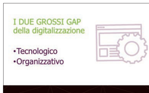
Fig. 1_Gap digitalizzazione.