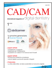
Immagine di copertina cortesemente concessa da cmf marelli srl, www.cmf.it