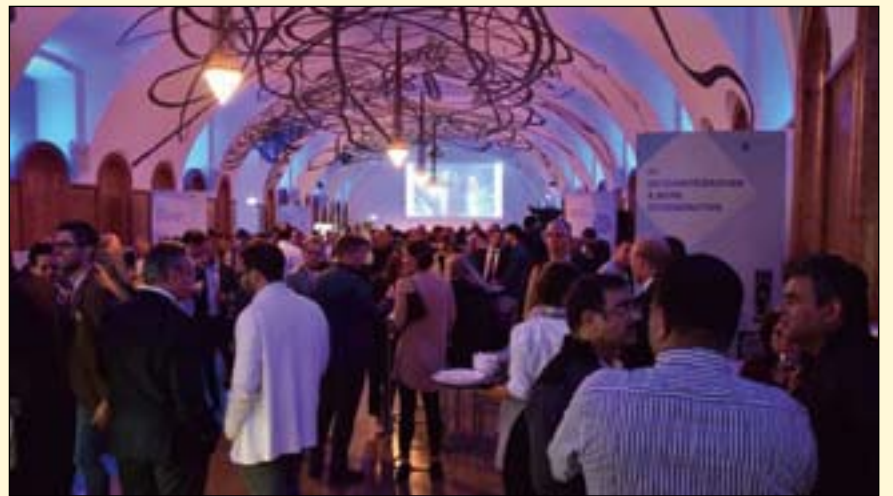
在维也纳的Hofstallung，350名牙科专业人员参加了骨再生基金会举办的聚会，来进行学术交流和人际沟通。