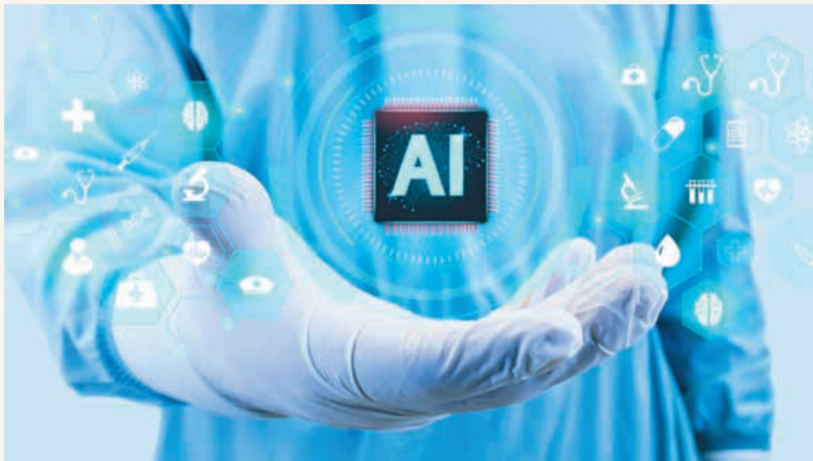
Различные ИИ-технологии могут помочь стоматологам буквально во всем: от управления клиникой и планирования хирургических вмешательств до диагностики и прогнозирования развития заболеваний.

Путь ИИ в стоматологию был долгим. Такие уже привычные для нас технологии, как машинное зрение, позволили повысить точность диагностики. Эти системы были предназначены в основном для извлечения данных, тогда как принятие решений оставалось за экспертом. Однако появление больших языковых моделей (LLM), например ChatGPT, предвещает пересмотр этой парадигмы. Не ограничиваясь обработкой и представлением данных, LLM