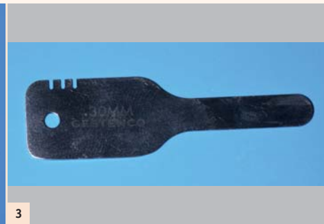
Fig. 3: L'utilisation de la jauge va permettre de mesurer avec exactitude le manque de céramique de la prothèse.