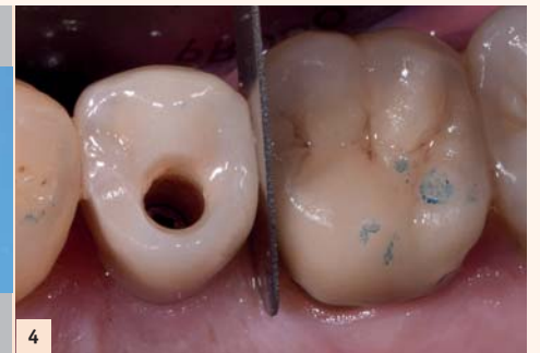
Fig. 4: Plusieurs essayages sont nécessaires dans le choix de la jauge. Il est essentiel qu'elle entre en force. La 0,30 mm est choisie et l'information donnée au laboratoire. Celui-ci doit posséder le trousseau, ou bien la jauge choisie est donnée.