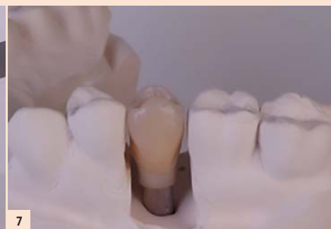
Fig. 7: Maître modèle ajusté avec précision. Notez l'espace réalisé entre 25 et 26. Le prothésiste peut dès lors réaliser l'ajout de céramique et gérer le point de contact.