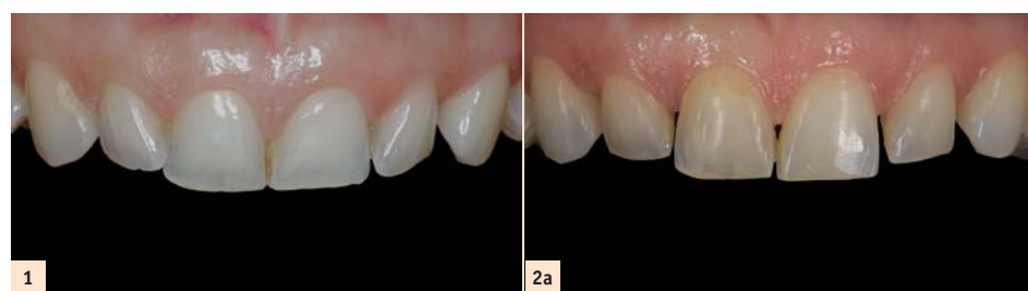
Fig. 1 : Photographie initiale des dents antérieures avant le traitement orthodontique. Fig. 2a : Dents antérieures après le traitement orthodontique. Fig. 2b : Dents antérieures après le traitement orthodontique.

besoin de matériaux de restauration qui reproduisent fidèlement les dents naturelles des patients. Utilisée initialement pour fabriquer des prothèses en céramique, la céramique feldspathique est devenue le premier matériau esthétique pour les restaurations personnalisées au moyen de facettes. Depuis peu, on a assisté à un regain d'intérêt dans l'utilisation de la céramique