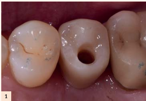
Fig. 1: Point de contact insuffisant en distal de la 25, lors de l'essayage. De quelle épaisseur ? Comment la communiquer au laboratoire ?