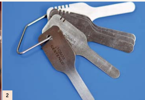
Fig. 2: Jauge de Sheridan. Jauge IPR (InterProximal Reduction) de Gestenco qui sert à calibrer les largeurs de stripping pour l'orthodontie. Les jauges augmentent progressivement de 0,10 mm et sont maintenues sur un trousseau.