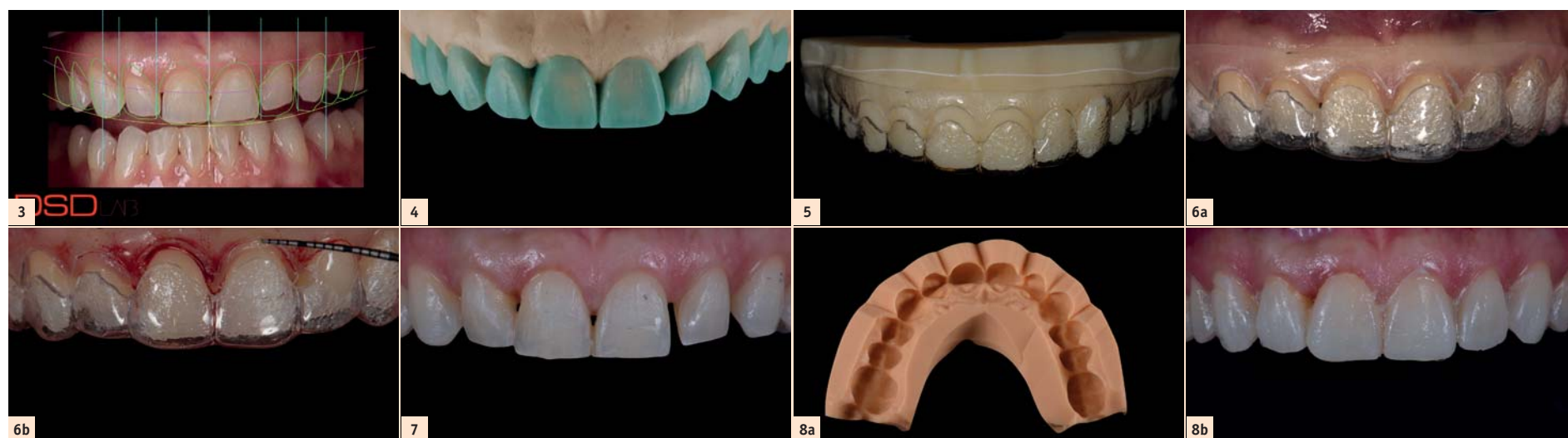
Fig. 3 : Conception numérique du sourire montrant l'élongation coronaire des dents 13, 12, 11 et 21 ainsi que le traitement de restauration des dix dents antérieures. Fig. 4 : Warm-up sur le modèle en plâtre pierre en vue du traitement de restauration des dix dents antérieures. Fig. 5 : Modèle imprimé en 3D issu de la conception numérique du sourire, pourvu d'un make-up. Une ouverture au niveau cervical a été prévue pour faciliter l'accès et le guidage au cours de la chirurgie d'élongation coronaire. Figs. 6a et b : Adaptation intraorale du guide chirurgical utilisé pour l'élongation coronaire. Fig. 7 : Tissu parodontal des dents antérieures six mois après l'élongation coronaire. Fig. 8a : Clé en silicone selon le mock-up. Fig. 8b : Dents antérieures après le traitement orthodontique.

Une patiente âgée de 35 ans s'est présentée au cabinet dentaire avec le souhait profond d'un changement de l'esthétique de la région antérieure (Fig. 1). Une maquette en cire diagnostique a été réalisée puis un mock-up en composite afin d'avoir une représentation préliminaire du résultat final. Le traitement orthodontique proposé visait à un alignement plus favorable des dents de façon à ne requérir qu'une préparation minimale pour la pose des facettes et à réduire le recouvrement incisif. Une année après le