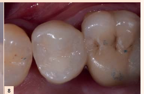
Fig. 8: Prothèse terminée avec une surface de contact puissante et bien située.