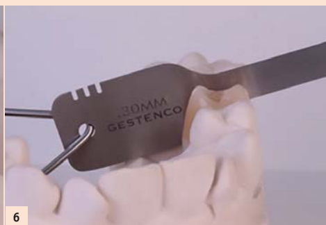
Fig. 6: Le stripping est réalisé jusqu'à ce que la jauge choisie de 0,30 mm puisse passer.