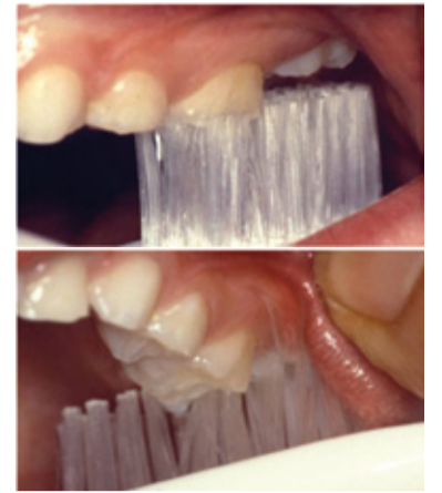
Tijdens de doorbraak wordt het element overgeslagen als de tandenborstel in de lengterichting op de tandboog wordt geplaatst. Als je de borstel dwars op de tandboog zet, is adequate reiniging mogelijk.