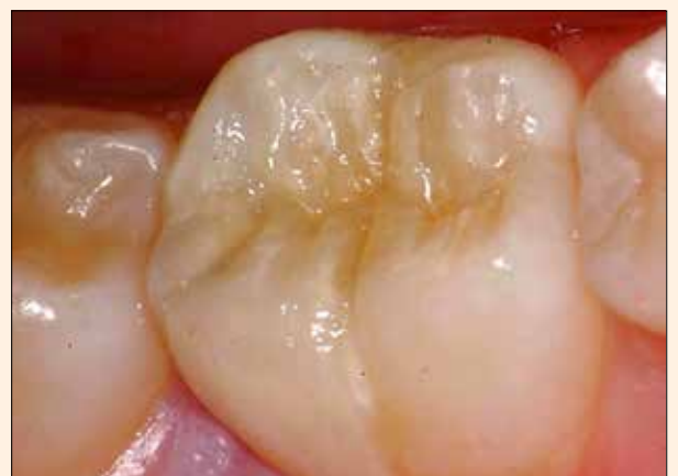
Figura 2. Restauración final donde se observa la biomimética lograda en fosas, surcos y vertientes cuspidas internas.