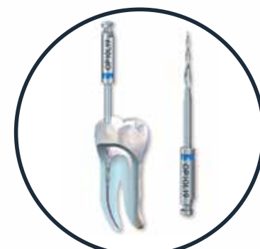
Opener Εργαλείο διάνοιξης στομίου, μεγέθη: 30/10

ΜΩΡΙΣ ΦΑΡΑΤΖΗ Α.Ε. ΟΔΟΝΤΙΑΤΡΙΚΑ ΑΠΟ ΤΟ 1884