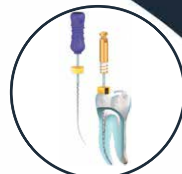
PathGlider Εργαλείο διαβατότητας ριζικού σωλήνα, μεγέθη: 15/03 & 20/03