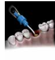
Διατήρηση Μετεξαστικού Φατνίου

Η διανομή οστικού μοσχεύματος στο ιγμόρειο είναι δύσκολη και απαιτητική. Το σύστημα του Novabone με τον κάλυκα επιτρέπει την ανεμπόδιση διανομή του μοσχεύματος στο ιγμόρειο απλοποιώντας την διαδικασία.