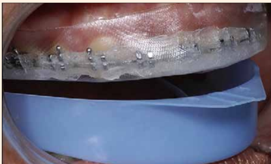
Fotografía de la remoción de la cubeta externa, dejando la férula blanda que contiene el aclarador en posición, publicada en Dental Tribune.

En las citadas publicaciones expresamos conceptos de aclaramiento dental que sostienen que los peróxidos son polidireccionales y penetran el esmalte por un proceso llamado osmolaridad. Otra cosa a tener en cuenta es que estos artículos los publicamos en «journals» súper estrictos: todas las fotos que entregamos para publicación fueron sometidas a veri-