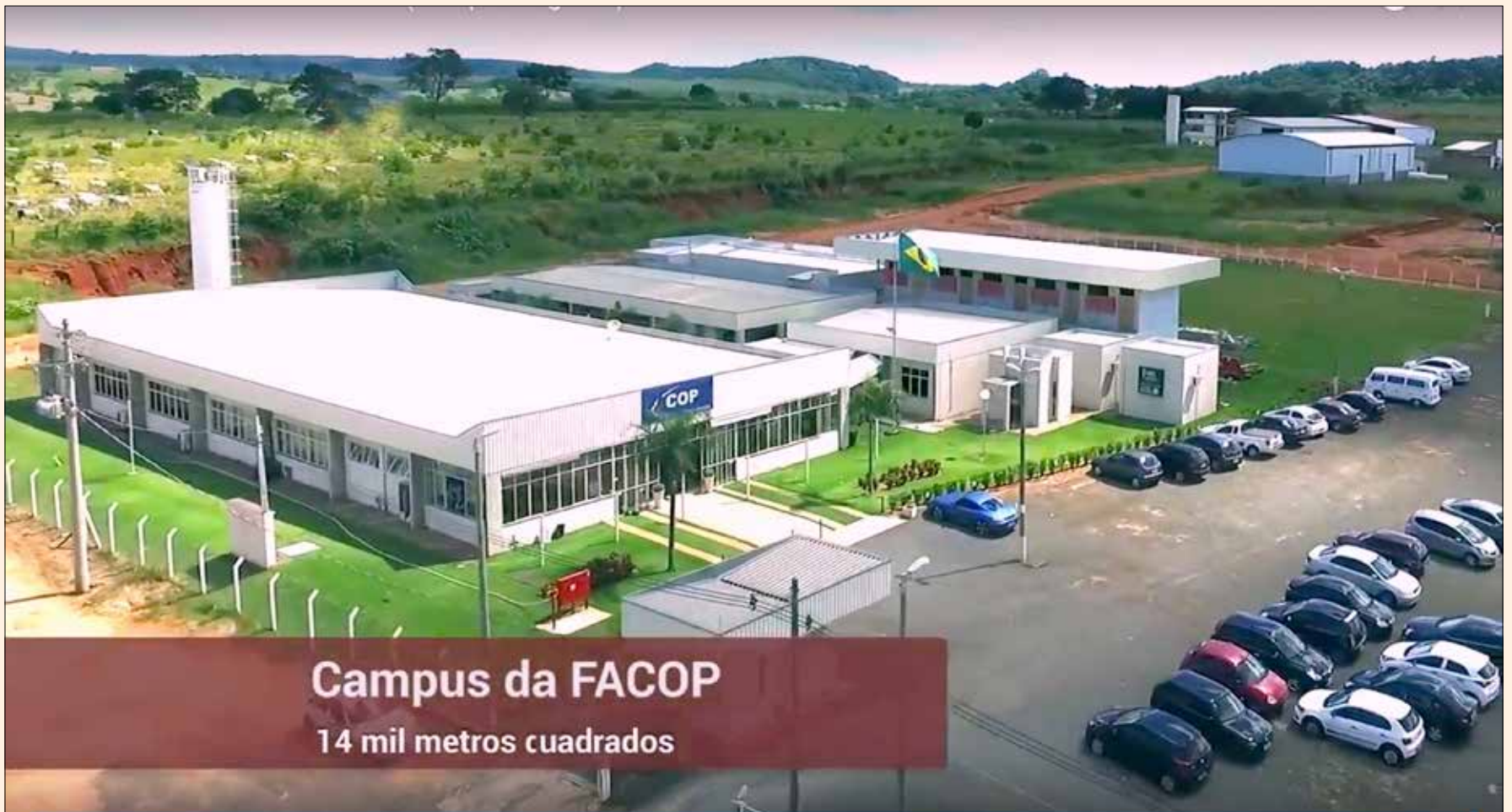
El campus universitario de FACOP en Baurú, São Paulo.