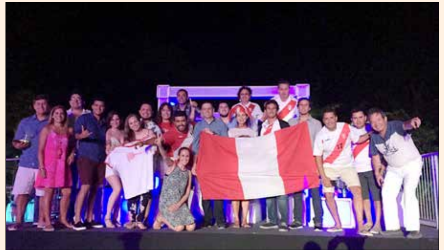
Un grupo de prominentes odontólogos peruanos en la Conferencia Global, que tuvo una gran asistencia latinoamericana.

Vea los videos publicados en el Canal de YouTube de DT Latinoamérica