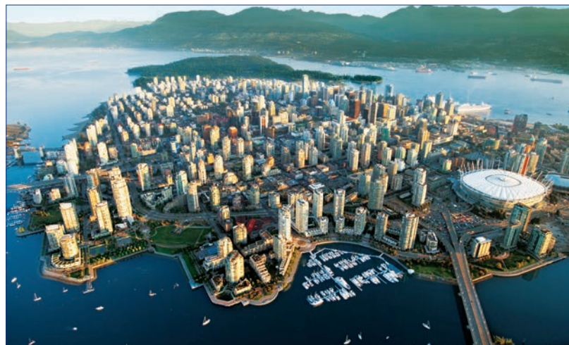
· Vancouver est la ville hôte de la Conférence Dentaire du Pacifique. · Vancouver hosts the Pacific Dental Conference.