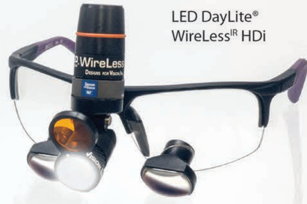
LED DayLite® WireLess IR HDi

Touch-free operation eliminates cross contamination