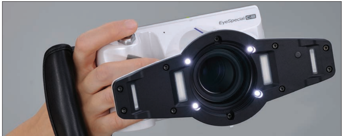
■ La caméra numérique EyeSpecial C-III. • The EyeSpecial C-III.

Lorsqu'il est combiné à une fonction de dessin / édition, qui permet de prendre des notes directement sur les images, cet attribut est d'une valeur immense pour une évaluation efficace du traitement ou une discussion sur les progrès ou les défis associés à la modalité. Conçue pour offrir une grande fonctionnalité, la caméra EyeSpecial C-III ultralégère (pesant environ 1 lb) est conforme aux protocoles de contrôle des infections. Le boîtier de l'appareil photo est robuste, résistant à l'eau, aux produits chimiques et aux égratignures et il peut être rapidement désinfecté avec une lingette stérilisante, éliminant ainsi pratiquement toute possibilité de contamination croisée.