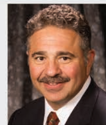
John Kois Aesthetics Occlusion/TMD