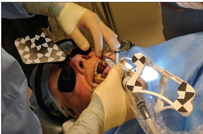
• (Photo / Fournies par Dr. George A. Mandelaris) • (Photo/Provided by Dr. George A. Mandelaris)

After only a short experience with Trace and Place technology in my practice, I have come to believe that it is a real tipping point for dynamic navigation guidance. I have streamlined and simplified the workflow in both diagnosis and surgical phases to allow state-of-the-art technology to be an everyday component of my surgical implant practice. I can’t imagine going back.