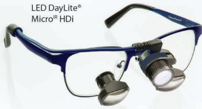
LED DayLite® Micro IR HDi

Fonctionnement sans contact élimine la contamination croisée