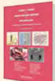
Clínica y Cirugía del Nervio Dentario Inferior en Implantología Autor: Dr. Juan José Soleri Cocco Más de 250 páginas Encuadernación de Lijo