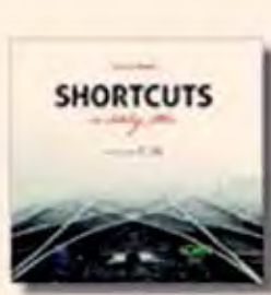
Shortcuts en Odontología Estética Autor: Dr. Ronaldo Horta 690 páginas a todo color Tamaño: 25x25 cm Encuadernación de Lijo

• Atlantis Editorial: atlantiseditorial.com