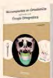
Microimplantes en Ortodoncia aplicada a la Cirugía Ortognática Autor: Dr. Hyo-Sang Park Más de 200 páginas