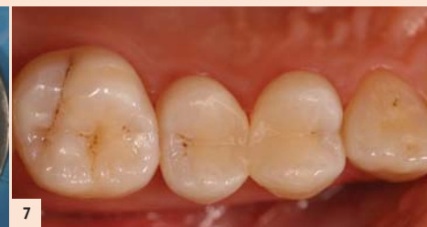
Fig. 7 : Résultat à 18 mois. La vitalité pulpaire est préservée et l'intégration esthétique des restaurations réussie.