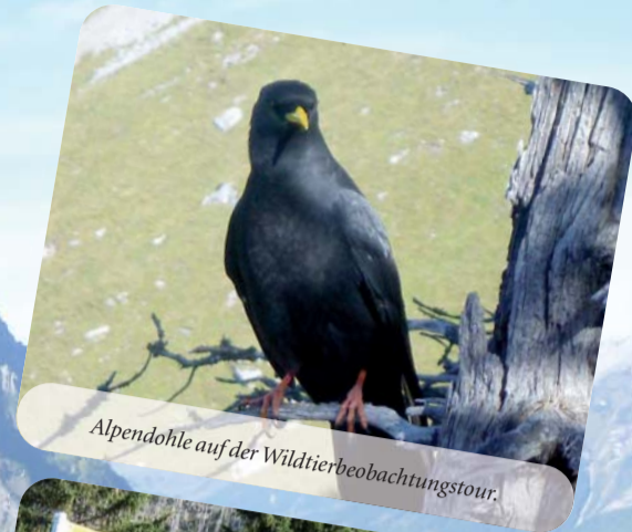
Alpendohle auf der Wildtierbeobachtungstour.