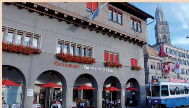
After Work Apéro im „Haus zum Rücken“, Zürich.