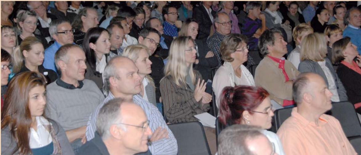
340 Gäste kamen zum Kundenanlass der Martin Engineering AG nach Greifensee.

Martin Engineering, der führende Anbieter von IT-Lösungen für Zahnärzte, lud zum traditionellen Kundenanlass