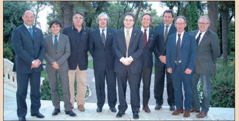
Il nuovo Esecutivo Andi.

Numerosi e importanti ospiti hanno assistito alla riapertura