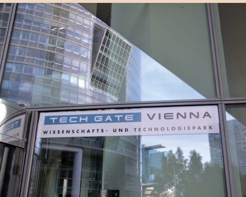
Abb. 7: Im Tech Gate Vienna in Donaustadt befindet sich das neue Fortbildungszentrum ICDE.