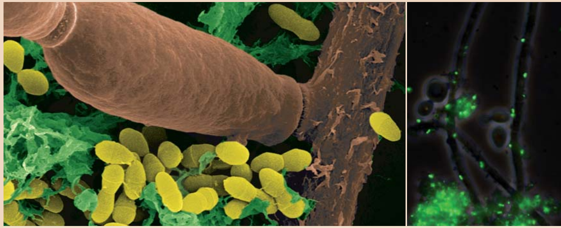
Links: Nahaufnahme eines Biofilms bestehend aus zwei humanen Krankheitserregern, dem Pilz Candida albicans und dem Karies fördernden Bakterium Streptococcus mutans . Die Produktion von extrazellulären polymeren Substanzen (EPS) des Bakteriums, die Karies auslösen können, wird durch den Pilz gestoppt. – Rechts: S. mutans -Zellen fluoreszieren grün. Sie tragen ein Gen für das grün fluoreszierende Protein und sind mit dem Promotor des Quorum-sensing gesteuerten alternativen sigma-factor SigX verbunden. Das Quorum-sensing-System wurde durch den Pilz induziert.

„Wir haben uns das Zusammenspiel von Streptococcus mutans und Candida albicans genauer angeschaut und festgestellt, dass das Bakterium im Beisein des Pilzes seine Virulenz verändert“, sagt Prof. Irene Wagner-Döbler, Leiterin der Arbeitsgruppe „Mikro-