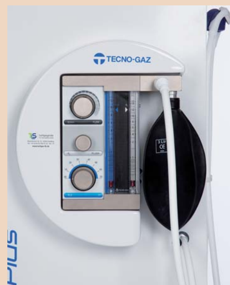
Lachgasgerät (ohne Zubehör).