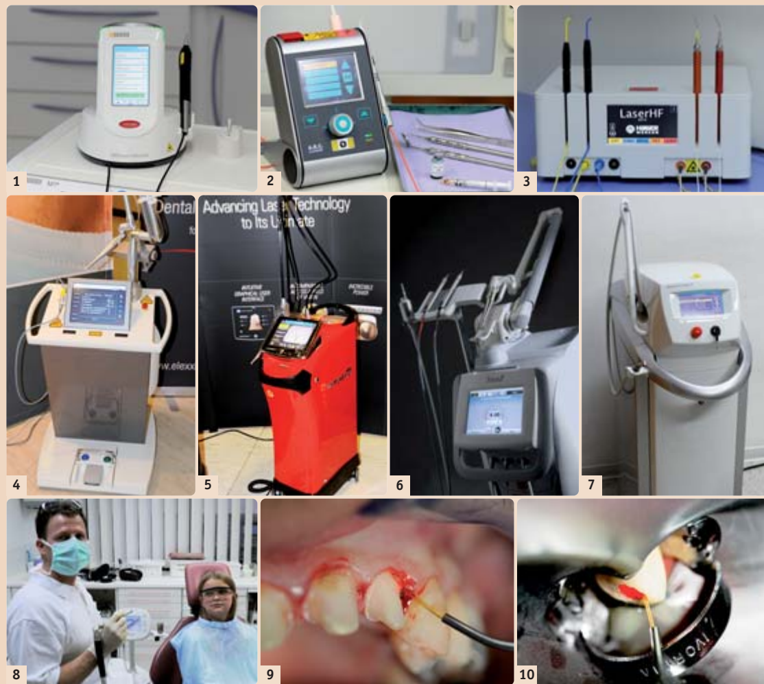
Abb. 1: SIROLaser Advance, ein kleiner, handlicher, komfortabler und für seine Sicherheit und Design ausgezeichneter Diodenlaser (Sirona Dental Systems GmbH). – Abb. 2: Diodenlaser Firma A.R.C. Laser GmbH Q 810, welcher auf den fotodynamischen Farbstoff EmunDo für die antibakterielle Photodynamische Therapie (aPDT) abgestimmt ist und erstmals 2011 auf der IDS in Köln vorgestellt wurde (Q810/FOX). – Abb. 3: Laser HF (Hager & Werken GmbH & Co. KG): das einzige Kombinationsgerät weltweit mit zwei Lasereinheiten 975 nm/6 W und 660 nm/25–100 mW sowie HF-Chirurgiekomponente 2,2 mHz für einfaches, schnelles und präzises Schneiden von Weichgewebe. – Abb. 4: elexxion delos 3.0, Kombination aus Er:YAG-Laser und 810 nm Diodenlaser mit bis zu 50 Watt Leistung und einer variablen Pulsierung bis zu 20.000 Hz (elexxion AG). – Abb. 5: Waterlase iPlus mit dualer Wellenlänge 2.780 nm und 940 nm – iLase (Firma Biolase Europe GmbH). – Abb. 6: Lightwalker von Fotona, Kombination aus Er:YAG- und Nd:YAG-Laser mit, laut Herstellerangaben, extrem hoher Schneidleistung im Hart- und Weichgewebe. – Abb. 7: KaVo KEY 3+ Laser, Er:YAG-Laser, Fa. KaVo Deutschland. – Abb. 8: LiteTouch™ (Syneron Dental Lasers) mit der bisher einzigartigen Laser-im-Handstück-Technologie (Er:YAG-Laser), klein und handlich. – Abb. 9: Stufenfreilegung und Hämostase bei Pfeilerpräparation mit Diodenlaser. – Abb. 10: Wurzelkanaldekontaminierung mit Nd:YAG-Laser.

So ist auch das Arbeiten im Molarenbereich unter klinischen Bedingungen gut möglich und eine geschlossene Kürettage im Seitenzahnbereich für den Behandler leichter durchzuführen (Liebaug und Wu 2011). Das ausgeklügelte