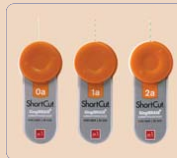
ShortCut – ein revolutionäres All-in-one-System zur Retraktionsfadenabgabe.

Bei den Hygieneprodukten passen wir uns stets an die aktuellen Gesetzgebungen und länderspezifischen Richtlinien an. Darüber hinaus greifen wir aktuelle Studien auf. Doch auch aus dem Feedback von Zahnärzten ziehen wir Inspirationen für Optimierungen. So hat DUX Dental die PeelVue+ Sterilisationsbeutel optimiert und einen Schließ-Validator eingefügt. Die Seitenränder des PeelVue+ Sterilisationsbeutels sind bereits vorversiegelt, das Sterilisationsgut kann direkt in den Beutel gegeben und bequem mit der selbstklebenden Verschlusslasche geschlossen werden. Anschließend erfolgt die Sterilisation in den handelsüblichen Auto-/Chemiklaven. Die patentierten inneren und äußeren Verarbeitungsindikatoren (IPI) am PeelVue+ Sterilisationsbeutel geben an, ob die Verarbeitungsbedingungen eingehalten wurden. Nach Entfernen der transparenten Folie kann