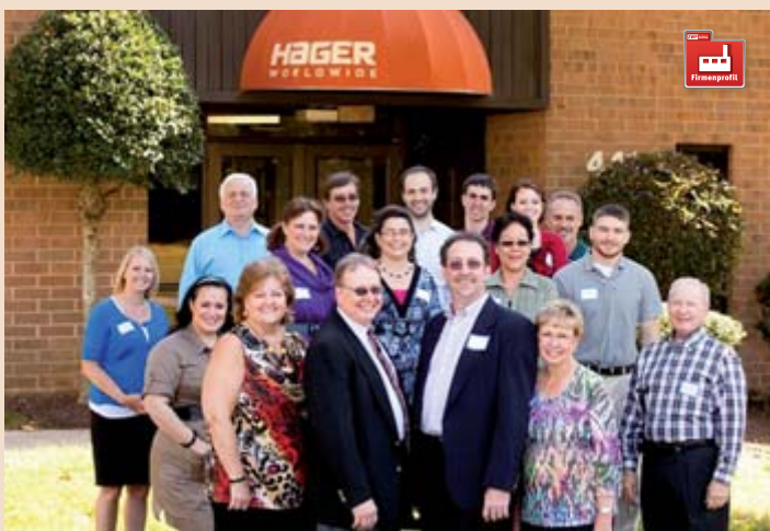
Das Hager Worldwide Vertriebs-Team.

Hager & Werken hat sich mit seinen zahlreichen qualitativen Produkten fest im Dentalmarkt etabliert – und das weltweit.