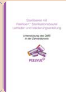
PeelVue™ Sterilisationsbeutel mit Leitfaden zur Unterstützung des QMS in der Zahnarztpraxis.