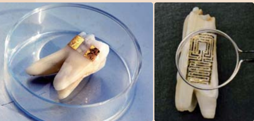
Graphen-basierter Nanosensor auf Zahnschmelz.