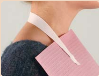
Bib-Eze™ Serviettenhalter werden einfach mit der Klebecke auf der Papierserviette angebracht und nach der Behandlung entsorgt.

die aus Papier bestehende Seite des Beutels als sterile Tray-Unterlage benutzt werden und zeugt bei Patienten somit auf eine hygienische Arbeitsweise.