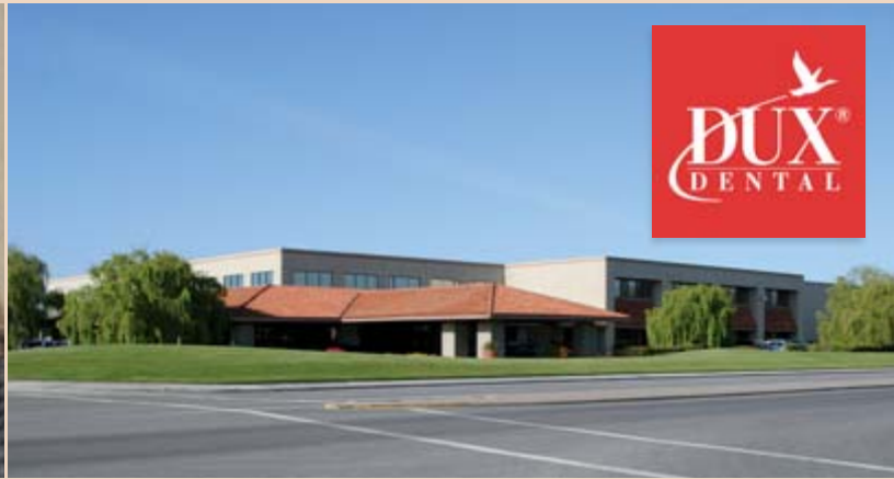
Hauptsitz der Firma DUX Dental nördlich von Los Angeles, Kalifornien.

Marktführer für dentales Verbrauchsmaterial. Unser Kernabsatzmarkt in Europa ist eindeutig Deutschland. Neben unserem Standort in den Niederlanden sind darüber hinaus aber auch Frankreich, England sowie die südeuropäischen Länder und Skandinavien wichtige Absatzmärkte.