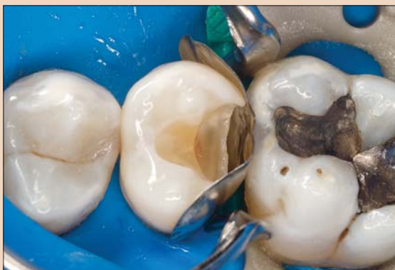
Рис. 3. Размещение «активной» секционной матрицы.