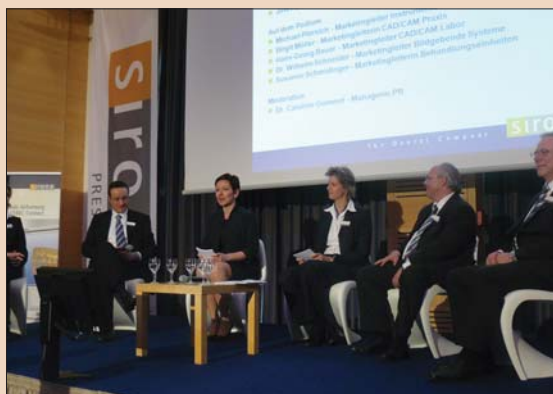
Пресс-конференция фирмы Sirona на Международном стоматологическом симпозиуме 2011 г.