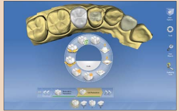
Программные средства CEREC фирмы Sirona.