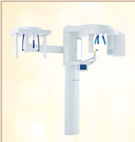
Трёхмерная рентгеновская установка ORTHOPHOS XG фирмы Sirona.