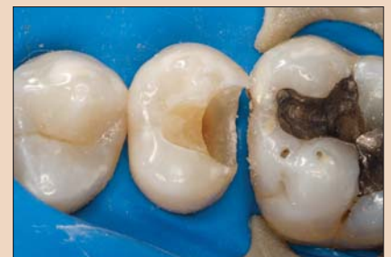
Рис. 2. Раббердам наложен, дефектная реставрация удалена.