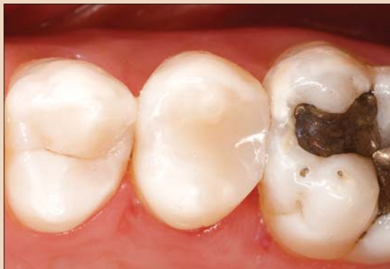
Рис. 6. Готовая реставрация.