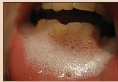
Рис. 2. Гигиеническая пенка Oral Care Foam 2 in 1 в полости рта.