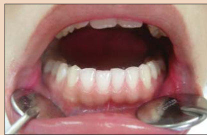
Рис. 4. Результат после применения гигиенической пенки Oral Care Foam 2 in 1. Практически полностью удален зубной налет в межзубных промежутках и в пришеечной области зубов.