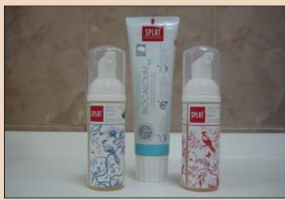
Рис. 1. Гигиеническая пенка Oral Care Foam 2 in 1 (Splat).

Основной причиной развития кариеса и заболеваний пародонта являются микроорганизмы зубной бляшки. Именно поэтому ведущую роль в лечении и профилактике стоматологических заболеваний играет гигиена полости рта. На стоматологическом приеме в рамках мероприятий по профессиональной гигиене полости рта производится полное удаление зубных отложений с помощью различных современных средств и методов. Однако подобные процедуры выполняются слишком часто, поэтому гораздо