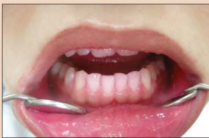
Рис. 3. Окрашивание мягкого зубного налета индикатором.

В целом в исследуемой группе пациентов отметили значительное снижение индекса ОНИ-S с 1,6 \pm 0,3 до 0,9 \pm 0,2 (рис. 3, 4).