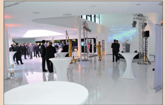
Центр инноваций фирмы Sirona в Бенсхайме (Германия).