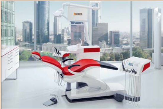
SINIUS – новый лечебный центр и звезда нового класса эффективности фирмы Sirona.