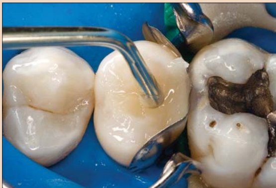
Рис. 5. Работа с гибридным композитом.