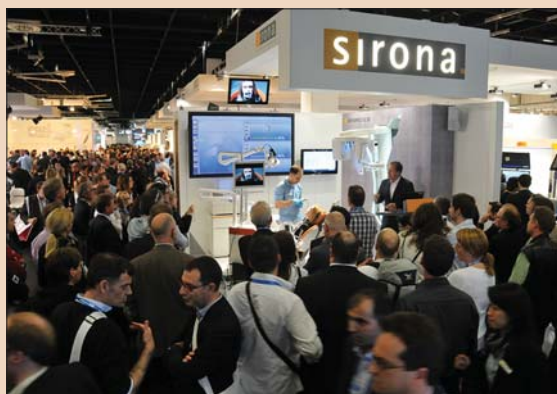
Всегда активно посещаемый выставочный стенд фирмы Sirona на Международном стоматологическом симпозиуме 2011 г.

Оба изделия были представлены на IDS 2011 г. и получили не только восторженные отзывы посетителей, но и признание рынка. Сканер inEos был создан для техников, и он им действительно нравится! Благодаря интуитивно понятному управлению сканирование осуществляется быстро, точно и эффективно. Этот сканер, пользующийся огромным успехом, стал краеугольным камнем нашей линии товаров для стоматологических лабораторий.