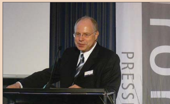
Джост Фишер, президент и генеральный директор компании Sirona, на пресс-конференции компании Sirona во время Международного стоматологического симпозиума 2011 г. (ДП/Фото Клаудии Сальвичек).

Что касается новых инструментов, то на выставке мы показали SI-ROBoost – мощную турбину, обеспечивающую бесперебойную работу.