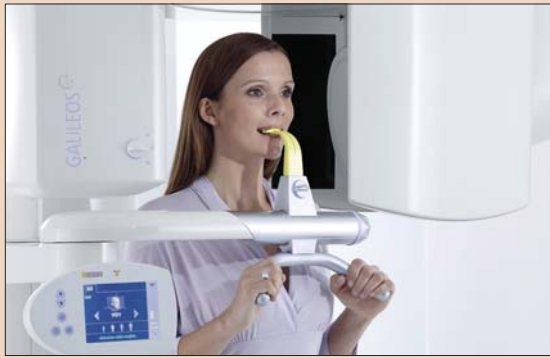
GALLEOS – конусообразная лучевая технология в зубоорудочной практике.

Мы очень серьезно относимся к такому понятию, как социальная ответственность. Участие в общественной деятельности является важным аспектом работы компании Sirona. Мы считаем, что несем ответственность перед нуждающимися и поэтому участвуем как в корпоративных, так и в местных мероприятиях. Например, мы поддерживаем стоматологические клиники Перу, Танзании и Ганы, бесплатно снабжая их оборудованием. Некоторые программы мы осуществляем совместно с нашим партнером-дистрибутором, компанией Henry Schein; к таким проектам относится, например, поддержка крупнейшей некоммерческой организации SCO Family of Services в Нью-Йорке, для которой мы вместе с компанией Henry Schein провели благотворительное мероприятие.