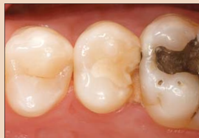
Рис. 1. Дефектная реставрация требует замены.