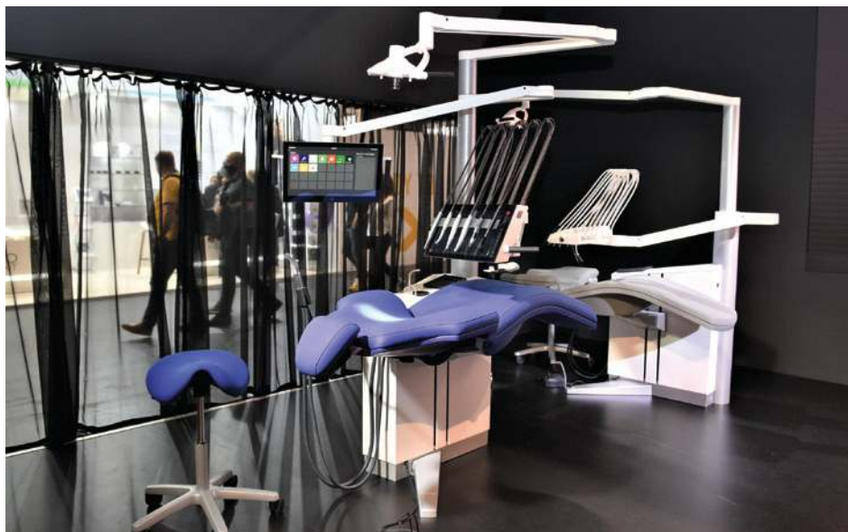
◀ Präsentation der Weltneuheit XO FLOW. ▶ World premiere of the XO FLOW.

For more information, IDS attendees can drop by Booth LO28/MO29 in Hall 10.2 or visit www.xo-care.com . ◀