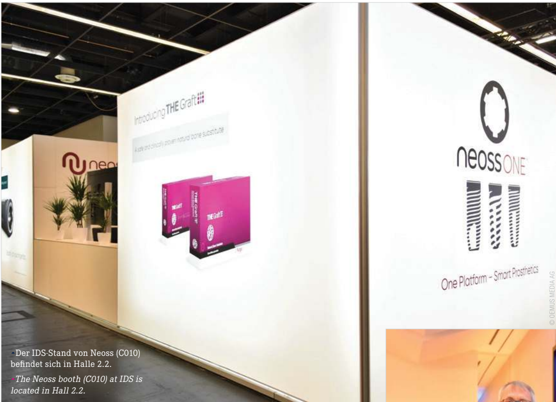
• Der IDS-Stand von Neoss (C010) befindet sich in Halle 2.2. • The Neoss booth (C010) at IDS is located in Hall 2.2.