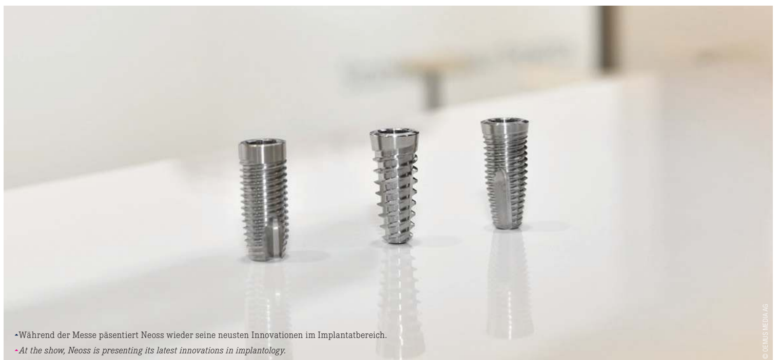
• Während der Messe präsentiert Neoss wieder seine neuesten Innovationen im Implantatbereich. • At the show, Neoss is presenting its latest innovations in implantology.

similarity to human bone. THE Graft has a very high degree of purity and a unique interconnecting pore system. It thus offers an optimised bone architecture for cell adhesion and tissue regeneration. ◀