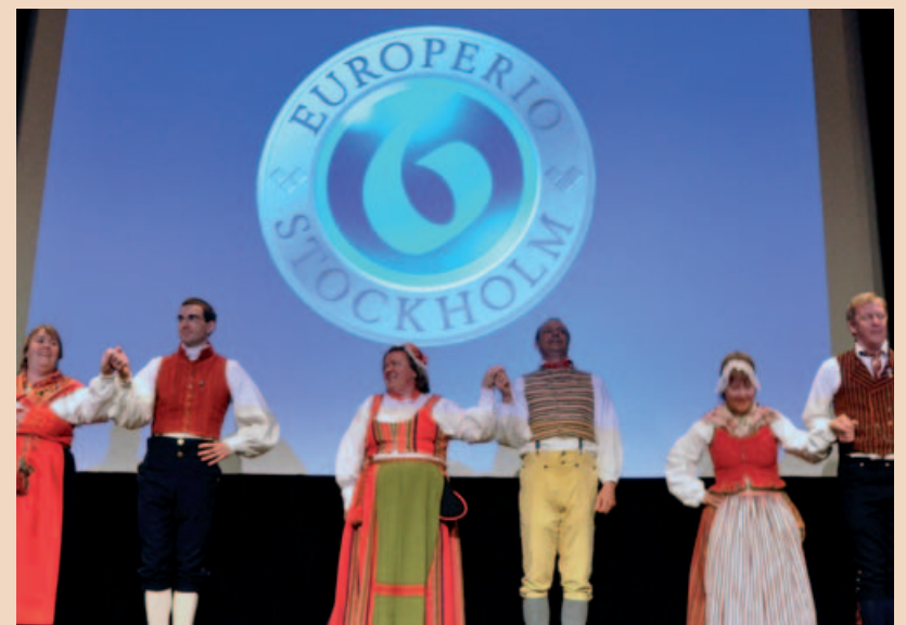
Anlässlich des Schwedischen Nationalfeiertages am 6. Juni endete der Kongress in der Schlusszeremonie mit einem traditionellen schwedischen Volkstanz.

Komplikationen und Misserfolgen. Ein weiterer Aspekt ist die Prävention und Handhabung von technischen wie mechanischen Komplikationen und Misserfolgen. Eine beträchtliche