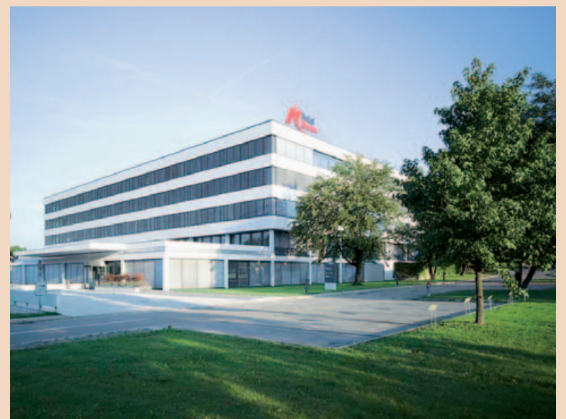
Der Hauptsitz von Nobel Biocare liegt in Zürich.

Kunden, Forscher und Meinungsbildner arbeiten wieder gerne mit Nobel Biocare zusammen und bringen sich auch gerne ein, weil wir wieder hinhören und viel zu bieten haben. Frühere Kunden kommen wieder zurück und neue hinzu, weil sie von unseren Produkten und Lösungen und vom neuen Weg von Nobel Biocare überzeugt sind. Die Entwicklung bestärkt mich, den eingeschlagenen Weg konsequent weiterzuverfolgen. Wir sind aber selbstkritisch und wissen, dass wir in unserer Kundenorientierung noch besser werden müssen, und daran arbeiten wir.