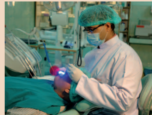
In Indien sind in letzter Zeit sehr viele moderne Zahnkliniken entstanden.

Mit Dental Tribune für den praktizierenden Zahnarzt hoffen wir, vom existierenden Netzwerk auf 25 internationalen Verlegern zu profitieren und ihre Expertise unserer großen Leserschaft in Indien nahezubringen. DT