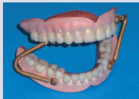
Kautschukprothesen mit Gebissfedern.

WIEN – Die ARGE „Geschichte der Zahnheilkunde“ und die ÖZMK Österreich präsentieren: „Die Geschichte der Prothetik“. Die Ausstellung findet im Kristallfoyer (1. OG) des Kongresshauses statt und kann von Donnerstag bis Samstag besichtigt werden.