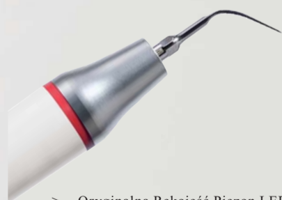
> Oryginalna Rękojeść Piezon LED ze Szwajcarską Końcówką PS

Coś więcej o profilaktyce > www.ems-swissquality.com