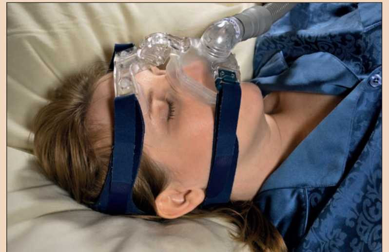
Un'immagine della maschera per il respiro notturno (CPAP).

un membro di uno staff multidisciplinare per la gestione dell'OSA. Lavorando insieme, dentisti, specialisti del sonno, otorinolaringoiatri, allergologi, cardiologi, neurologi e altri, si sarà più in grado di prestare la miglior terapia. Ad esempio, l'optimum per il trattamento di gravi casi di OSA è la pressione positiva continua (CPAP) per cui i dispositivi mantengono nelle vie aeree una pressione costante più elevata di quella atmosferica durante il ciclo respiratorio per favorire il reclutamento alveolare ed aumentare la capacità funzionale residua (CFR). Purtroppo, sebbene la terapia sia molto efficace, non tutti la tollerano. Si possono usare in alternativa altri apparecchi. In clinica, lavorando a fianco di specialisti del sonno, si usano apparecchiature per migliorare la compliance della CPAP, stabilizzando la mandibola con abbassamento della pressione dell'aria necessaria, sovente causa di non conformità della CPAP. Nel 2006, gli specialisti del sonno hanno pubblicato le linee guida della terapia OSA raccomandando la prescrizione di apparecchi con lieve e moderata diagnosi. Non ci sono però sufficienti dentisti qualificati: i colleghi medici spesso non conoscono gli speciali-