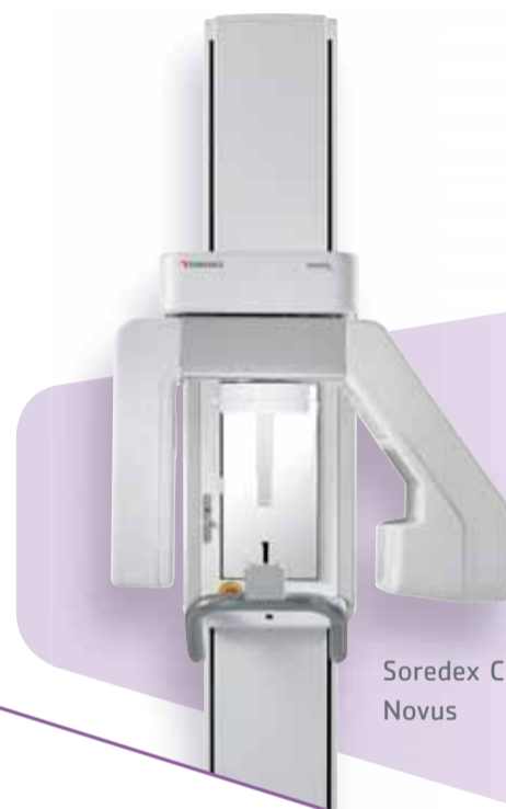
Soredex Cranex Novus