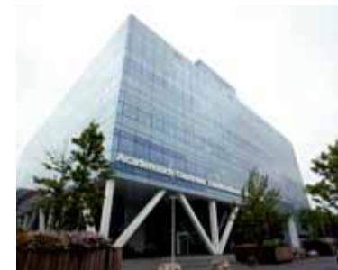
De keuze voor twee overkoepelende onderzoeksprogramma's door ACTA werd hooggewaardeerd door de externe commissie.

Ook de onderzoekskwaliteit van het zwaartepunt Oral Regenerative Medicine krijgt de kwalificatie 'excellent'. In het onderzoek gaat het om de biologische processen van adaptatie en herstel van bot en parodontium en de bio-compatibiliteit van materialen. De commissie noemt het bijbrengen van de celbiologie-subgroep en de prothetische/implantologie-subgroep een zeer positieve ontwikkeling. De celbiologen worden als excellent beschouwd in termen van originaliteit van denken, experimentele benaderingen, en kwaliteit en kwantiteit van onderzoeksoutput. De implantologen/tandarts-prothetisten worden beoordeeld als