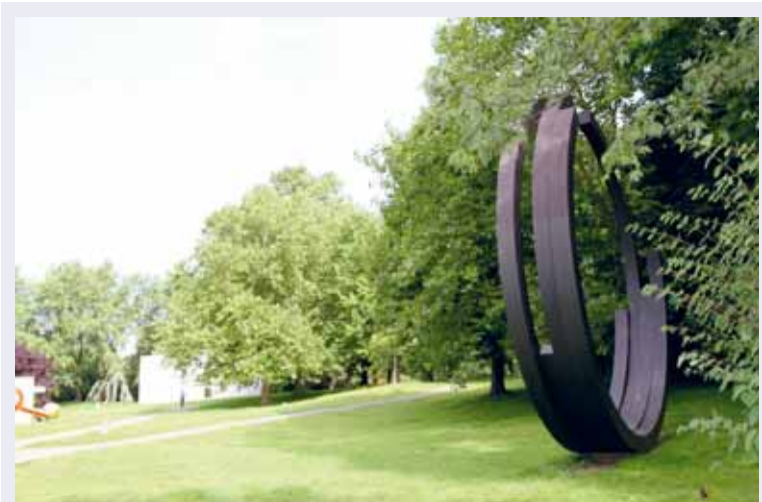
Het Skulpturenpark Köln, met op de voorgrond 'Four Arcs' van Bernar Venet.