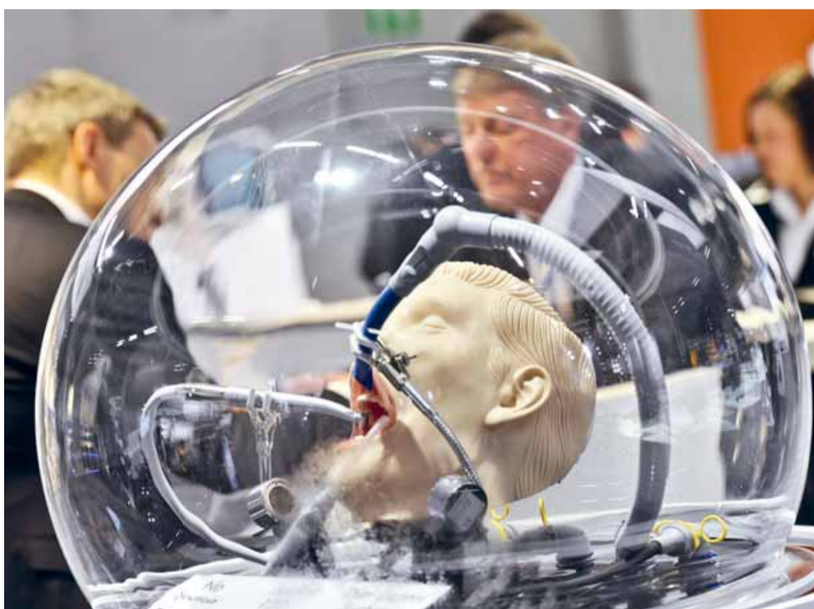
Met 2.150 exposanten en 130.000 bezoekers komt u op de IDS 2015 ogen tekort.