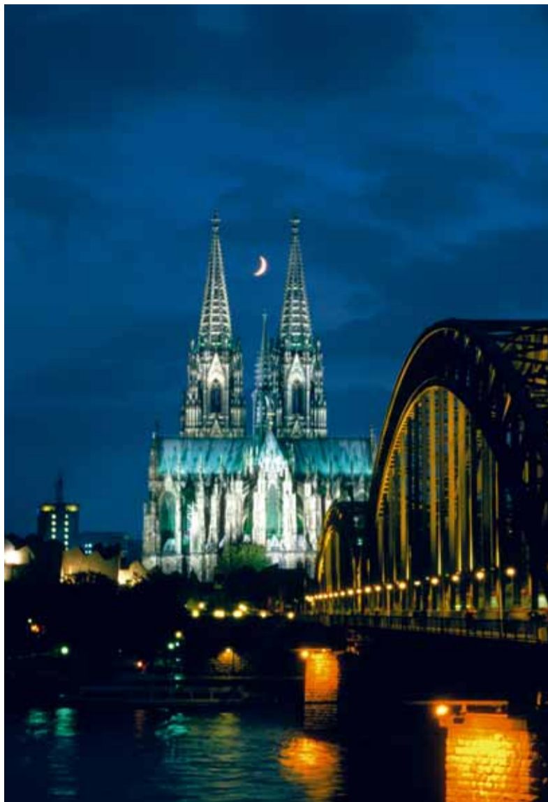
Twee blikvangers in één beeld gevangen: de Kölner Dom en de Hohenzollernbrücke.

De aanblik van de stad was een eeuw geleden bepaald anders. Het statige stadcentrum werd in de Tweede Wereldoorlog echter grotendeels verwoest. Dat de Dom tegenwoordig nog overeind staat, is eigenlijk een wonder te noemen. De reusachtige gotische kerk fungeerde gedurende de bombardementen voor vliegniers als oriëntatiepunt en kreeg 14 bominslagen te verduren. Het gebouw werd zwaar beschadigd, maar werd in de decennia erna in oude glorie hersteld. Ook de rest van de Altstadt kreeg een deel van zijn oude gedaante terug - zo