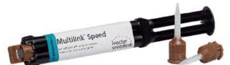
Multilink®Speed 一步式树脂水门汀

ivoclar vivadent passion vision innovation 义获嘉伟瓦登特公司