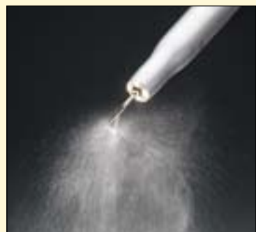
冷却液喷雾透过器械喷射到工作部位附近, 保证器械和硬组织都能获得最理想的冷却效果。

我在临床治疗中使用这一外科设备已有五个月左右, 对它的优势了如指掌。工作尖引入的独特冷却理念, 或者说工作尖与喷雾孔位置更加科学合理, 这不仅保证器械的工作流程更加优化, 而且实现最理想的冷却效果。不同的功能参数在任何时刻都能观察到。设备自