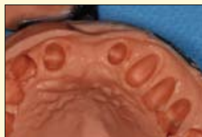
短桥的印模和模型