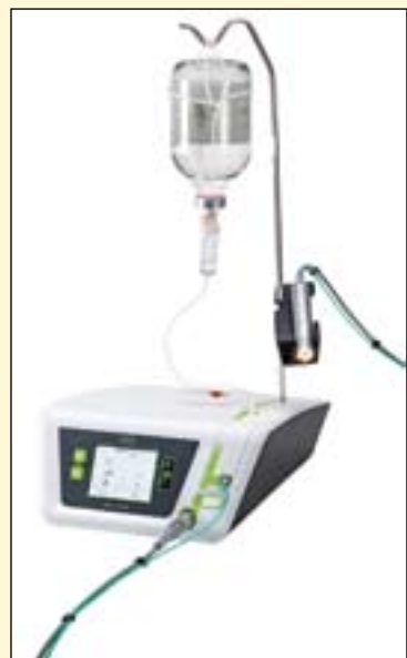
利用W&H Piezomed, 能够快速安全地进行外科介入手术。最先进超声技术允许以难以置信的精度进行骨切削。

“Piezomed预示着在口腔手术中运用压电技术新纪元的开始。天才设计的创新型工作尖系列为每种临床治疗提供理想的器械。例如, 专门设计的新骨刀齿头[专利申请中]允许进行最精确的骨切削, 以及允许进行二维预备。高效冷却理念的引入—避免极限热力学材料应力的破坏, 用户因此受益于更安全的手术部位处理。