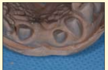
短桥的印模和模型