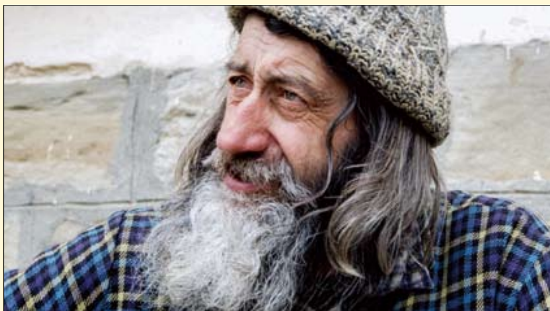
经济困难的老年人群余留牙明显少于经济富裕的同辈(图Camelia Varsescu)

改善, 比前人更加健康。然而, 该团队先前发表的研究表明, 尽管年轻人口腔比前人更健康, 但问及口腔健康如何改善或恶化、如何对他们产生影