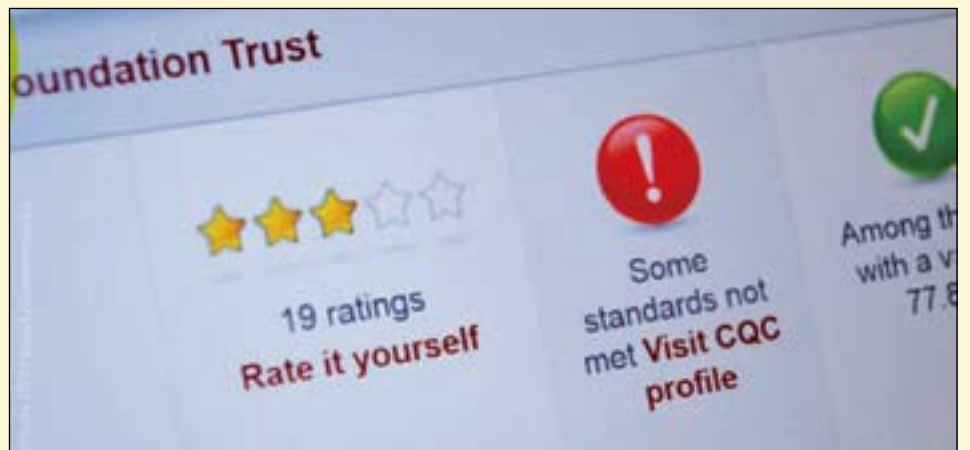
负面的在线评论可以对个人的牙科职业生涯造成严重的损害。

那些与被牙科管理委员会调查和清除的牙医相关的数据呢？这些数据对于他们来讲是公平的么？无论牙医在自己专业发展过程中投入了多少，患者需要了解他所有的事情么？