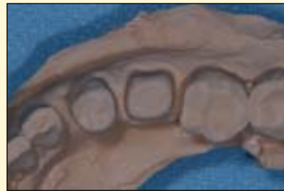
烤瓷冠印模和模型