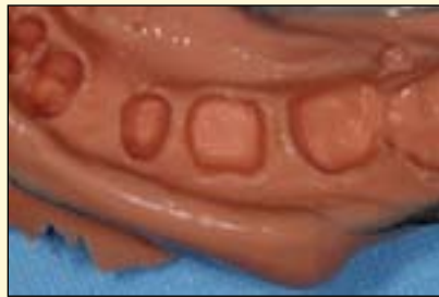
烤瓷冠印模和模型

目前, 我院主要将海琴运用于对颌模型、寄存研究模型、烤瓷与全瓷单冠、短桥、注塑与金属支架可摘局部义齿及全口义齿的印