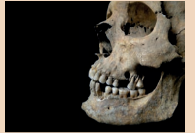
Fig. 2 - Cranio visto di norma laterale sinistra. L'emiarcata dentaria superiore ed inferiore sono ben conservate. Si reperta una vistosa retrazione alveolare a carico del secondo e terzo molare superiore cui è contigua una perforazione ossea della porzione alveolare del mascellare in corrispondenza dell'apice della radice del primo molare superiore esito di un granuloma. Si noti la perdita post mortem del canino inferiore e la netta usura armonica dei molari inferiori. Analogamente a quanto osservato a carico dell'emiarcata destra, è presente discreto e diffuso deposito di tartaro e reazione ossea al colletto indicativa di paraodontopatia cronica.