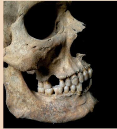
Fig. 1 - Alba (AT), Cattedrale. Epoca Medioevale. Ottimo stato di conservazione e completezza. Cranio visto di norma laterale destra. L'emiarcata dentaria superiore ed inferiore sono ben conservate. Si reperta una perdita in tra vitam del primo molare superiore con discreto riassorbimento osseo e la perdita post mortem dei due incisivi inferiori. Discreto e diffuso deposito di tartaro e reazione ossea al colletto indicativa di paraodontopatia cronica.

Un altro aspetto che sottolinea l'interesse antropologico e paleopatologico dei denti è che la loro