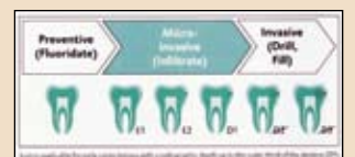
Εικ. 6 Η πρώτη θεραπεία για να γεφυρωθεί το κενό μεταξύ πρόληψης και αποκατάστασης.