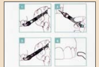
Εικ. 7 Δημιουργία λείας επιφάνειας.