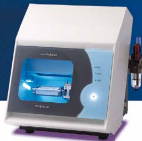
Fresadora Dental Compacta DWX-4

La serie DWX de fresadoras compactas de Roland ofrece las más asequibles y avanzadas opciones en restauraciones dentales. Con la introducción de la nueva Fresadora Dental en Húmedo DWX-4W, usted puede expandir sus habilidades para incluir cerámica feldespática, cerámica de vidrio, disilicato de litio y otros materiales populares. La DWX-4W es el complemento perfecto a la DWX-50 de cinco ejes, permitiéndole combinar una producción rápida y fluida con requisitos específicos de fresado. Y si está buscando una máquina que lleve a cabo trabajos pequeños y urgentes, no dude en contar con la DWX-4.