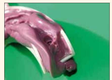
Fig. 5. Otra característica específica: ¿qué hacer en caso de que la bandeja sea «demasiado larga» por vestibular y resulta imposible tomar una impresión correcta?