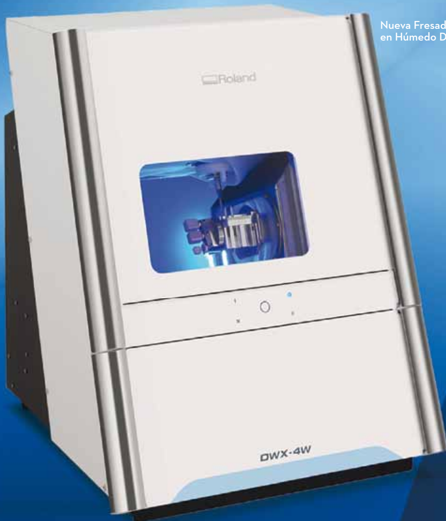
Nueva Fresadora Dental en Húmedo DWX-4W

Roland agrega la NUEVA tecnología de fresado en húmedo a su serie de productos DWX.