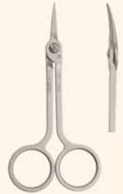
Cod. 3586 (mm 115) Curvo