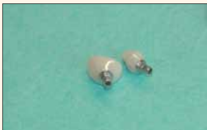
Fig. 11. Estándar contemporáneo: pilares cerámicos personalizados para evitar cementitis, con un «alma» de titanio para un atornillado seguro.