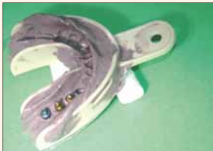
Fig. 10. Una vez que estén fijos en la impresión, están listos para fabricar un modelo de laboratorio.