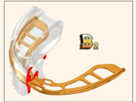
El sistema Myobrace de la serie Brackets™ es la última incorporación a la gama MYOBACE® de MRC.