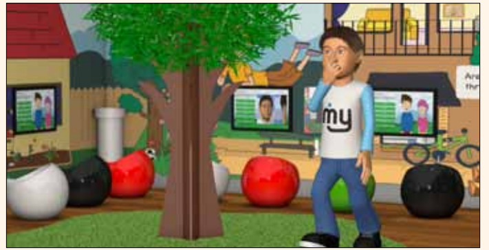
El innovador programa Myobrace Activities™ anima a los niños a jugar un papel activo en su tratamiento.

El altamente interactivo programa Myobrace Activities™, destinado a ser utilizado en conjunto con los aparatos MYOBACE®, está específicamente diseñado para presentar información educativa de forma coherente a pacientes jóvenes, a un nivel fácilmente comprensible y divertido a la vez. Si bien los auxiliares capacitados desempeñan un papel necesario en la educación del paciente, esta aplicación disminuye la cantidad de tiempo que estos miembros del personal