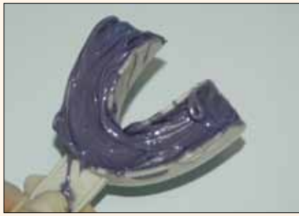
Fig. 7. Llene la bandeja con el material de impresión que utiliza normalmente.