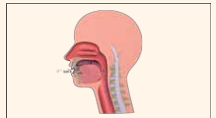
Los pacientes con disfunción de las vías aéreas probablemente tienen maloclusión, así como otros problemas de salud.