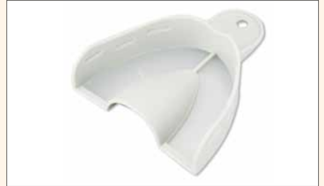
Fig. 2. La innovadora «técnica de papel de aluminio» es revolucionaria: evita tener que fabricar una (cara) cubeta individual —sea como fuere que personalice su bandeja (facturación)— y además le evita a usted y su paciente una segunda cita.