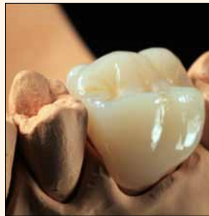
La fresadora DMX-4 de Roland y una muestra de la corona que es capaz de hacer.

Hasta hace poco, el Centro de Implantes Dentales, una clínica, laboratorio y centro de fresado dental ubicado en Caracas (Venezuela) tenía que lidiar con retrasos en la entrega de coronas