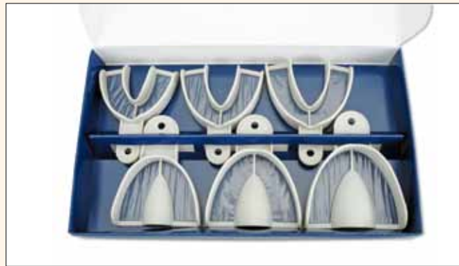
Fig. 1. Las cubetas de impresión Miratray Implant vienen en diferentes tamaños, dentados y desdentados, para la mandíbula superior e inferior.

La información publicada por Dental Tribune International intenta ser lo más exacta posible. Sin embargo, la editorial no es responsable por las afirmaciones de los fabricantes, nombres de productos, declaraciones de los anunciantes, ni errores tipográficos. Las opiniones expresadas por los colaboradores no reflejan necesariamente las de Dental Tribune International. ©2015 Dental Tribune International. All rights reserved.