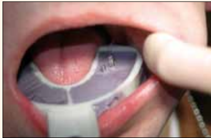
Fig. 8. Póngalo sobre los postes de impresión y perforo el papel aluminio, presionando ligeramente hasta que vea aparecer los tornillos.