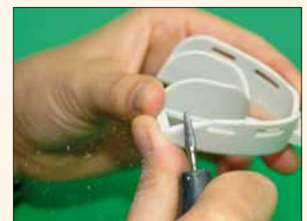
Fig. 6. Use una fresa para adaptarse fácilmente las necesidades del caso.