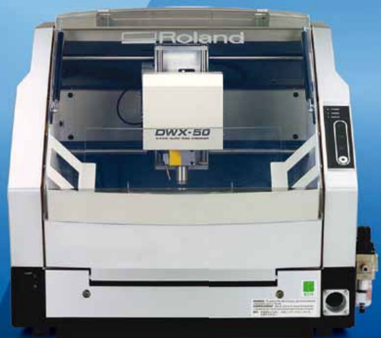
Fresadora Dental de 5 Ejes DWX-50