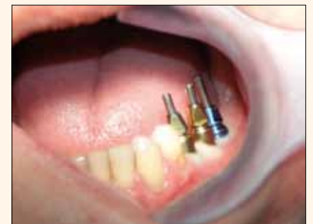
Fig. 4. Una situación familiar: tres implantes con postes atornillados para impresión abierta (pick-up).