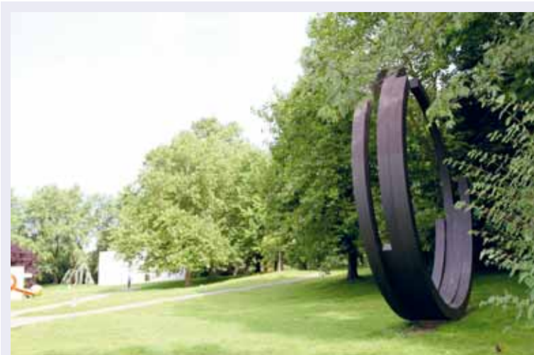
Het Skulpturenpark Köln, met op de voorgrond 'Four Arcs' van Bernar Venet.