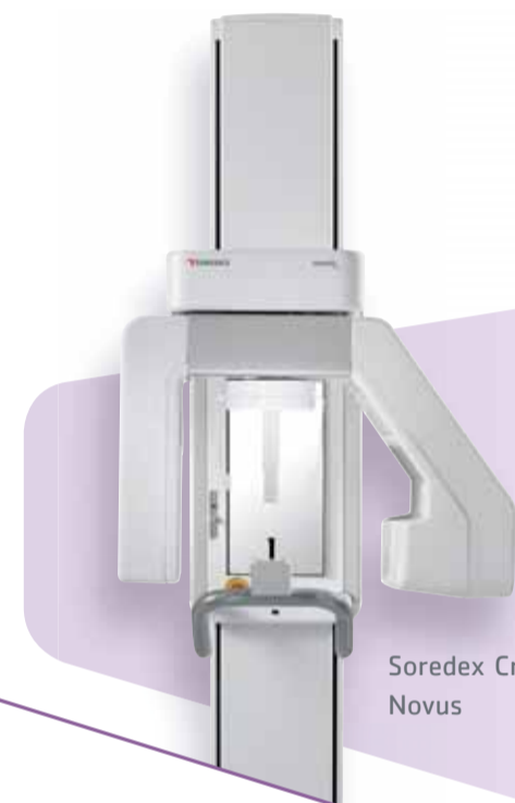
Soredex Cranex Novus