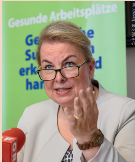
Bundesministerin Mag. Hartinger-Klein

„In meiner Funktion als Bundesministerin für Arbeit, Soziales,