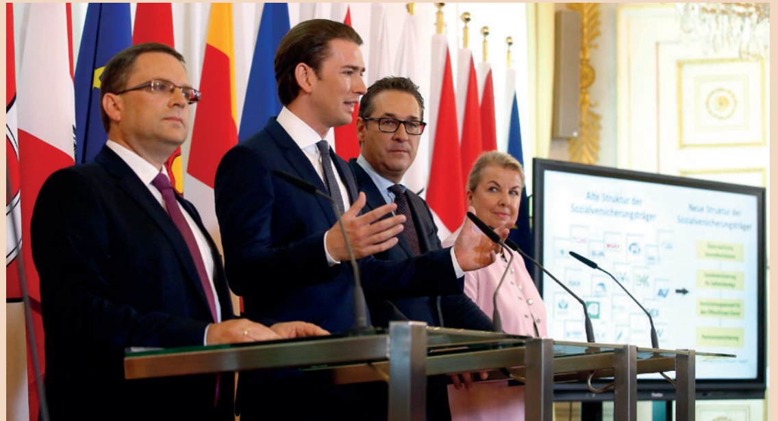
V.l.n.r.: August Wöginger, Sebastian Kurz, Heinz-Christian Strache und Beate Hartinger-Klein bei der Pressekonferenz am 22. Mai 2018.

Die Sozialversicherungsträger sollen zudem künftig von 21 auf maximal fünf reduziert, die neun Gebietskrankenkassen zu einer „Österrei-