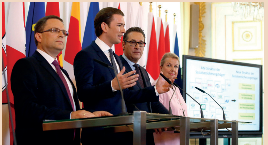
V.l.n.r.: August Wöginger, Sebastian Kurz, Heinz-Christian Strache und Beate Hartinger-Klein bei der Pressekonferenz am 22. Mai 2018.

Die Sozialversicherungsträger sollen zudem künftig von 21 auf maximal fünf reduziert, die neun Gebietskrankenkassen zu einer „Österrei-