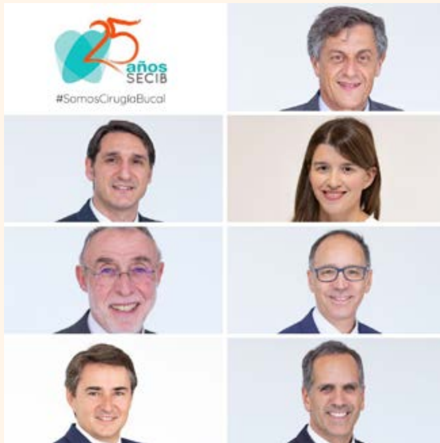
Fotografía compuesta por la Junta Directiva SECIB.

La enfermedad apareció en diciembre del año 2019 en Wuhan (China)