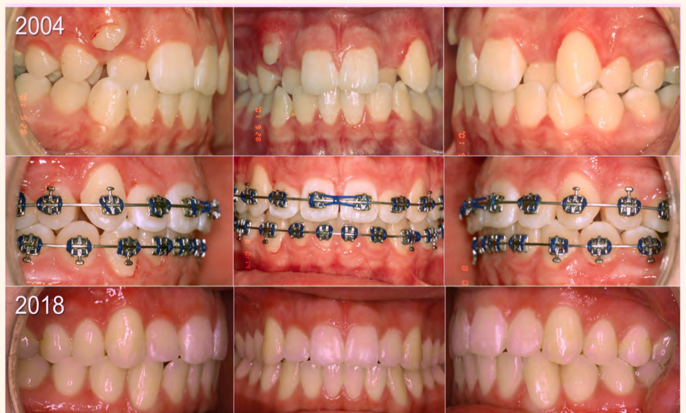
Figura 2. Tratamiento con nuestra Técnica SWLF de un marcado apiñamiento combinando brackets de fricción controlada (Synergy), arcos termoelásticos y orthostripping mecánico secuencial; resultado estable tras 12 años fuera de retención.