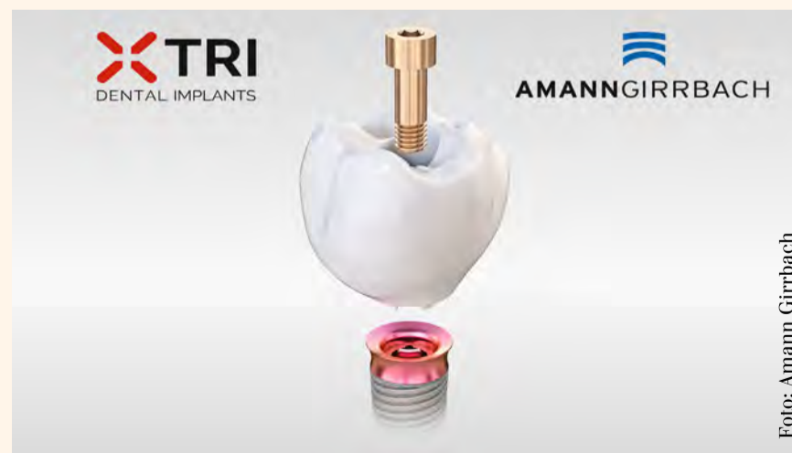
La geometría de la conexión desarrollada específicamente para la fabricación CAM por Amann Girschbach resulta en un ajuste extraordinariamente preciso del implante de un modo sencillo y seguro.