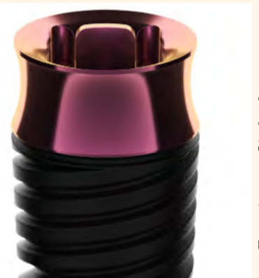
El nuevo implante matrix, que no necesita pilar, de TRI Dental Implants.

Amann Girschbach tiene en TRI Dental Implants, empresa que ha desarrollado los implantes de la línea matrix, el socio perfecto en la fabricación de las restauraciones. Amann Girschbach es proveedor de sistemas de soluciones CAD/CAM para el laboratorio y la clínica, y permite emplear flujos de trabajo validados con un máximo de eficiencia y seguridad. En el proyecto con TRI Dental Implants, además de una exhaustiva valoración de los procesos del software y de la maquinación, también se han validado diferentes materiales. En el futuro será posible, por ejemplo, fabricar coronas de alta precisión con Zolid DRS o Zolid Gen-X directamente sobre el implante, sin pérdidas en la función o en la estética. En combinación con el horno de