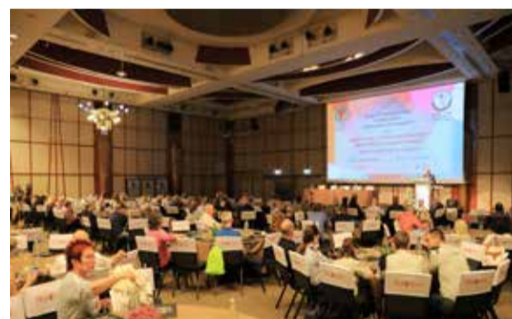
אולם ההרצאות מלא מפה לפה