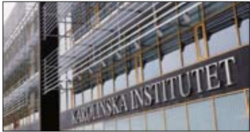
根据2015年QS世界大学学科排行榜，瑞典卡罗琳学院的牙医学科排名全球第一位。

陈总经理：作为带领定远的一个大家长，我是觉得蛮骄傲的。20年来，从定远走出去的员工超过2万人，大多数还在从事牙科科技这个行业，有的甚至自己创业做了老板！他们有了这个技术或者事业，在生活上基本上都可以养活自己、养活家庭，甚至可照顾更多的人，他们对社会都做出了或多或少的贡献，这算是定远对整个社会尽了些责任，这是我感到骄傲的另一件事！再一个就是，牙科科技行业还是一个以技术为前提的良心事业，技术、质量是1，管理啊营销啊宣传啊都是多个0，没有1这个前提再多的0都是无效的。所以希望未来的中国牙科科技能够踏实的以技术、品质为基础，抱着永续经营的理念走向未来，走向全世界！就像定远的企业理念一样——让全世界的人都拥有好牙！