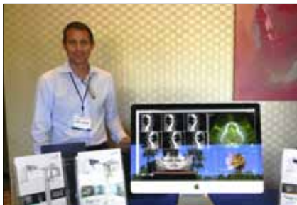
Uno de los sofisticados equipos para cirugía guiada que se presentaron en el LA Dental.