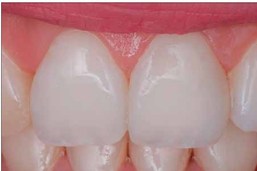
7. Detalle de la excelente estética obtenida y los colores de las resinas utilizadas.