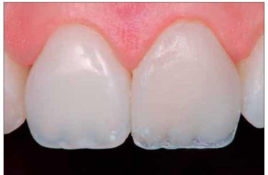
5. Tercio incisal relleno con resina translúcida incisal.