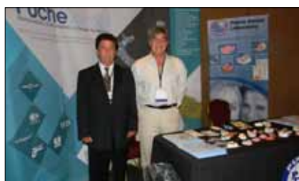
Los representantes del depósito dental Pu-che, una empresa hispana de larga tradición en Los Angeles.

dos días de conferencias, que culminaron con una gran fiesta de gala.