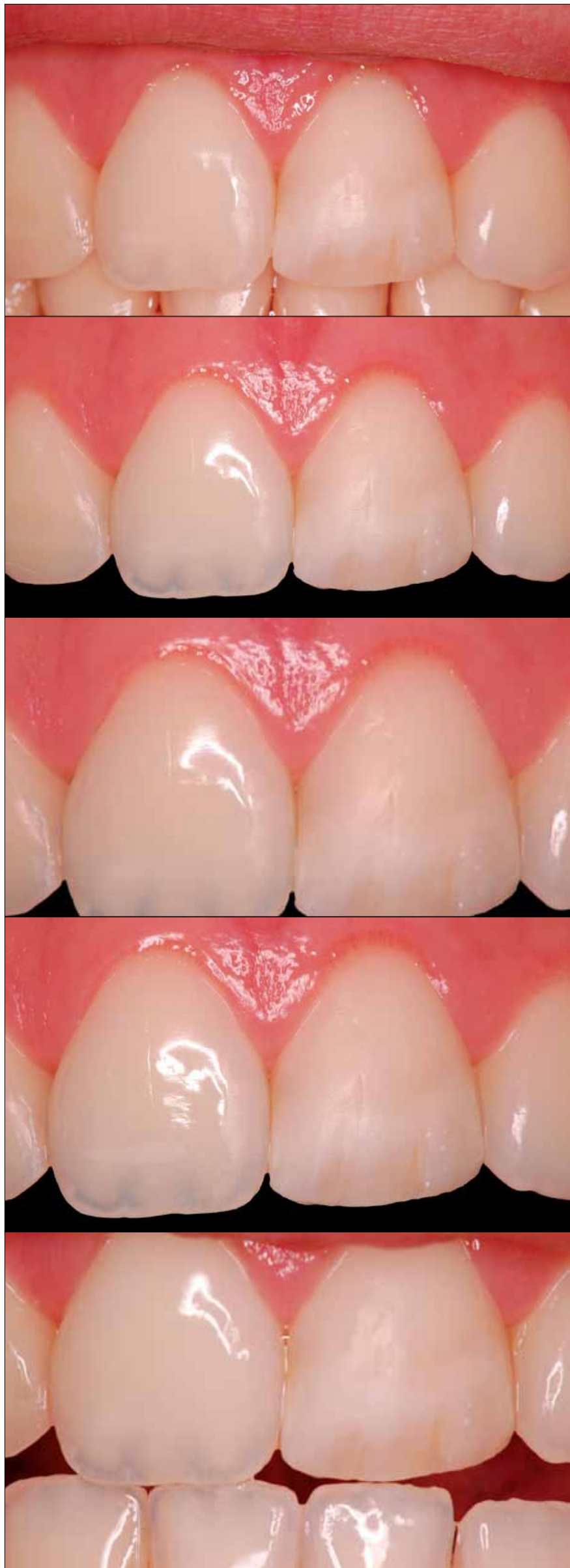
1b a 1f. Detalles de la falta de armonía estética desde distintos ángulos.

Paraná (UTP). Coordinador de los Cursos de Odontología Estética de ABO_São José dos Pinhais. Profesor Titular de Odontología y Clínica Integrada, Universidad Tuiuti de Paraná (UTP) y Profesor de Perfeccionamiento en Odontología y Prótesis Estética ABO_SJP. Brasil. Contacto: fabianoaraujo_@hotmail.com