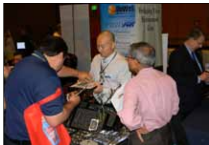
Marcado interés por los productos en la expo del evento.