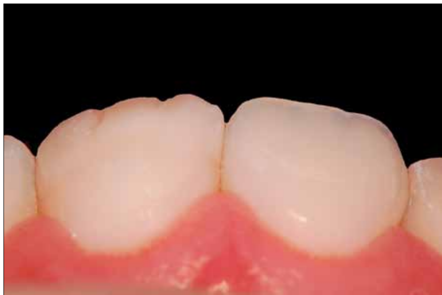
4. Aplicación de colorante blanco y resina EA1 para caracterizar los mamelones dentales.