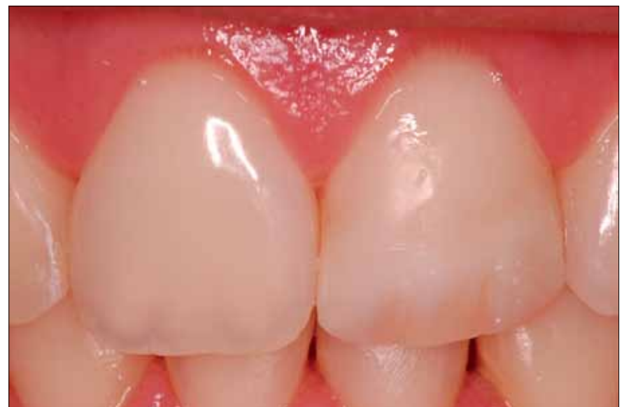
8. Aspecto inicial de la sonrisa.