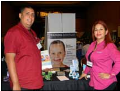
Los representantes de los correctores de MRC en el congreso de Los Angeles.