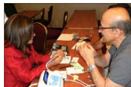
Uno de los talleres hands-on en el LA Dental Meeting.