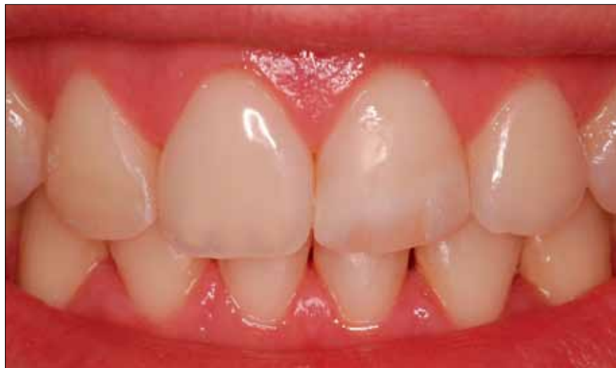
1a. Aspecto inicial de la sonrisa.