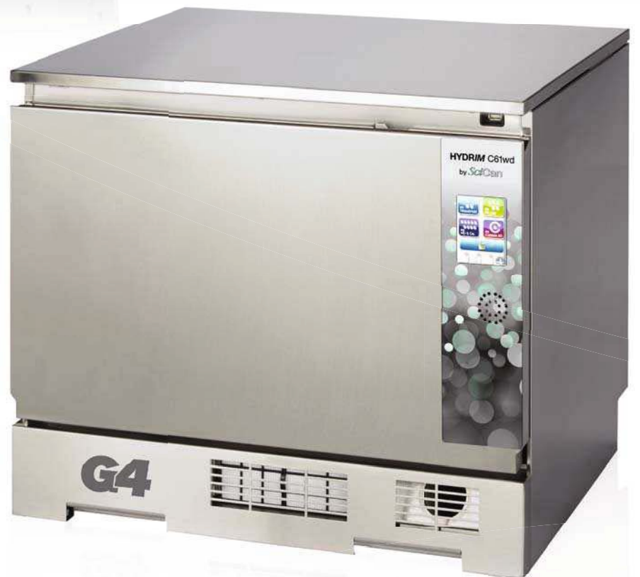
HYDRIM® C61wd G4 Thermodesinfektor Washer-Disinfector

SciCan Your Infection Control Specialist™