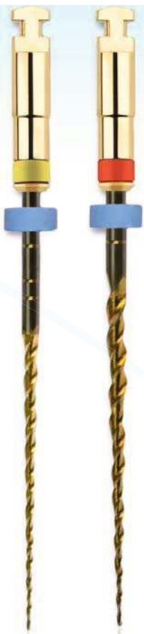
NEW 2Shape 2-Feilen-System Two files to shape

Come and discover our new highlights and enter our prize draw. Hall 10.2 Booth T20 / U29