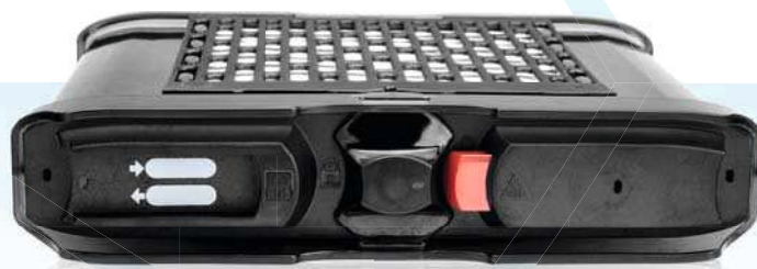
SALUS™ Steril-Container Sterility Maintenance Container