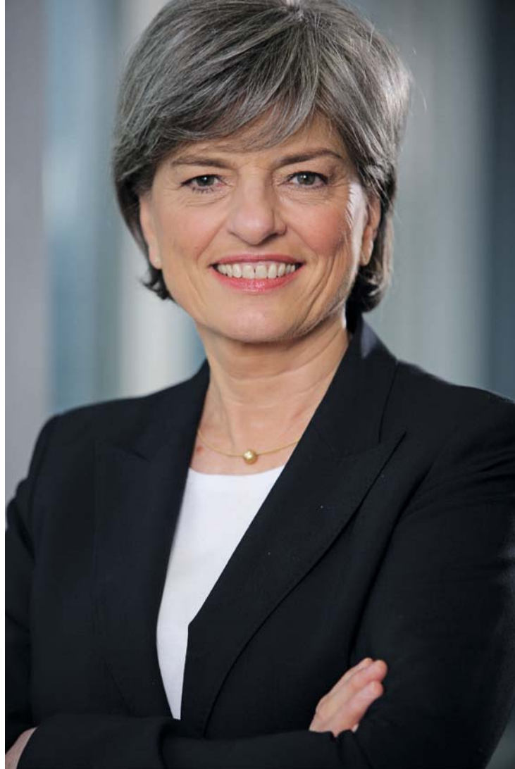
• Ute Berg

Die Dentalwirtschaft hat schon früh erkannt, wie wichtig die Digitalisierung ist und sich diese zunutze gemacht. Mit der Koelnmesse hat sich die IDS einen hervorragenden