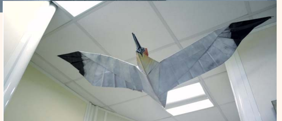
Un magnifique Origami, détail zen du cabinet, réalisé par l'oncle du Dr Vareth Ty Vallée.

L'abandon du métal, l'absence de douleur, un confort de mastication après la pose de l'élément prothétique... tous ces facteurs déterminent la réussite de la séance.