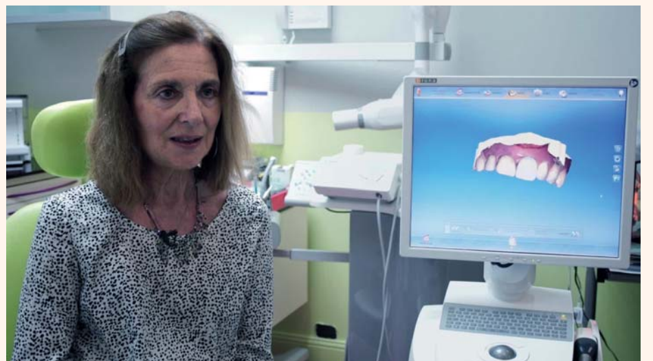
Une patiente heureuse de son traitement.

Pensez-vous que l'utilisation de la CFAO soit indispensable afin d'offrir le meilleur traitement possible à vos patients ?