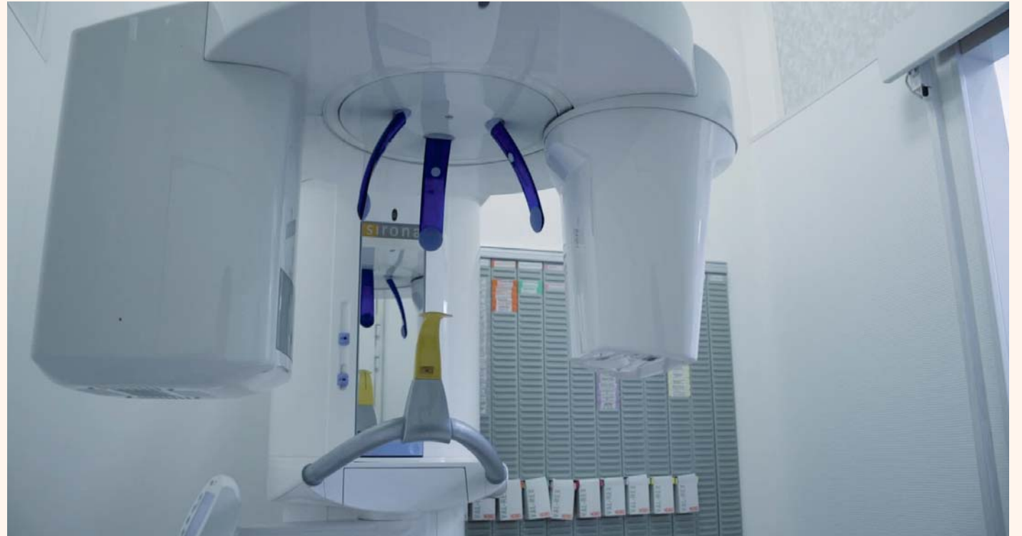
Salle de radiologie pour un diagnostic sûr.

Dans les cas plus simples d'un inlay ou d'une couronne, l'empreinte optique me donne un travail très précis, tant au niveau des limites qu'au niveau de l'interprétation des données numériques. Le design proposé correspond à la réalité clinique et je gagne beaucoup de temps tout en gérant le côté esthétique et fonc-