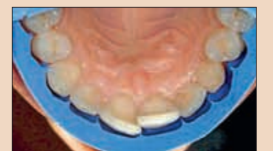
Фиг. 13. По восъчния моделаж се изработва силиконов индикатор (СИ), който ни ориентира по време на препарационната фаза. СИ се ажустира върху зъбите. Забележете, че той не може да бъде поставен пасивно върху зъбната дъга, поради протрудираната позиция на медиоинцизалната фаціальна повърхност на зъб 11.