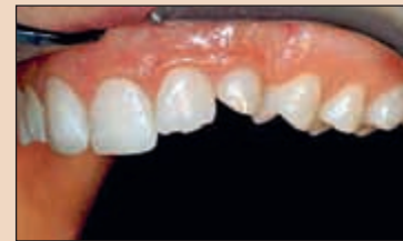
Фиг. 8. От този ъгъл лесно може да се оцени естетичната оклузална равнина (ЕОР). Ясно се вижда изместването ѝ нагоре в областта на канина.