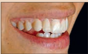
Фиг. 16. Визуализиране на завършения дизайн на усмивката преди да са препарирани зъбите чрез поставянето на ВКПОЕ. Временните конструкции трябва да са точно копие по отношение контурите, структурата и формата на завършените полифасетни възстановявания.

Хубавото при ВКПОЕ, освен възможностите за оценяване на естетичните и функцио-