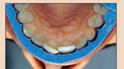
Фиг. 14. При такива ситуации се прави предварително естетично реконтуриране (ПЕР). Протрудираните повърхности на зъбите, разположени по-вестибуларно спрямо определените финални контури на окончателните полифасетни възстановявания се изпилват, така че силиконовият индикатор да се поставя пасивно върху зъбната дъга. Забележете изпиления медиоинцизален ъгъл на зъб 11 и пасивната позиция на СИ върху зъбната дъга след ЕПР. За да се оцени крайният резултат от предложения нов дизайн на усмивката, трябва да се изпробват временните конструиращи за предварително оценяване на естетиката (ВКПОЕ).