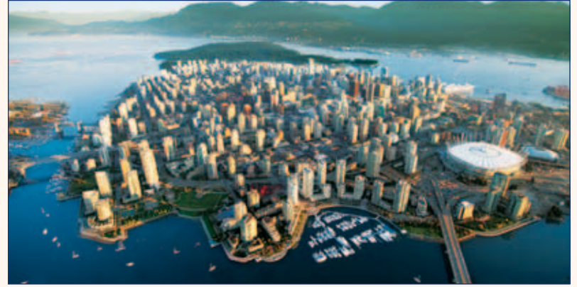
• Vancouver is host city to the Pacific Dental Conference, March 9–11, 2017, with more than 130 presenters, 150 open sessions and hands-on courses. • Vancouver est la ville hôte du Pacific Dental Conference, du 9 au 11 mars, avec plus de 130 conférenciers ainsi que 150 sessions de travaux pratiques.