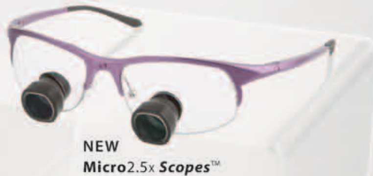
NEW Micro2.5x Scopes™