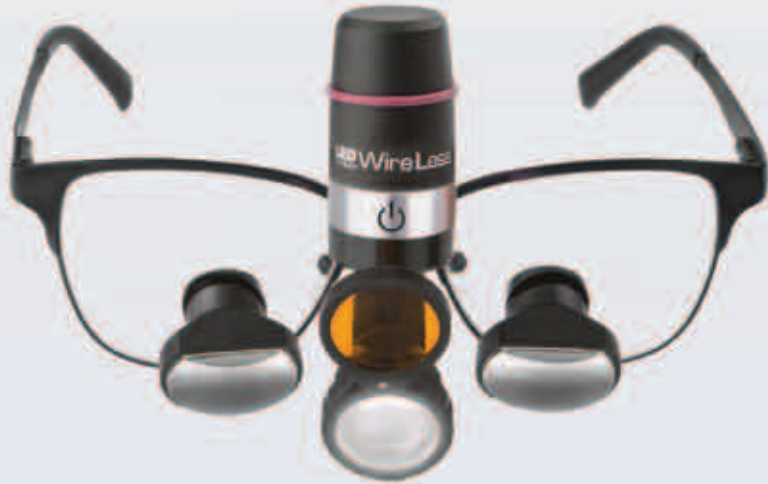
CLIPS ONTO YOUR EXISTING LOUPES shown here on NEW Steam frame

Totally WireLess Headlight - no wires, no battery pack