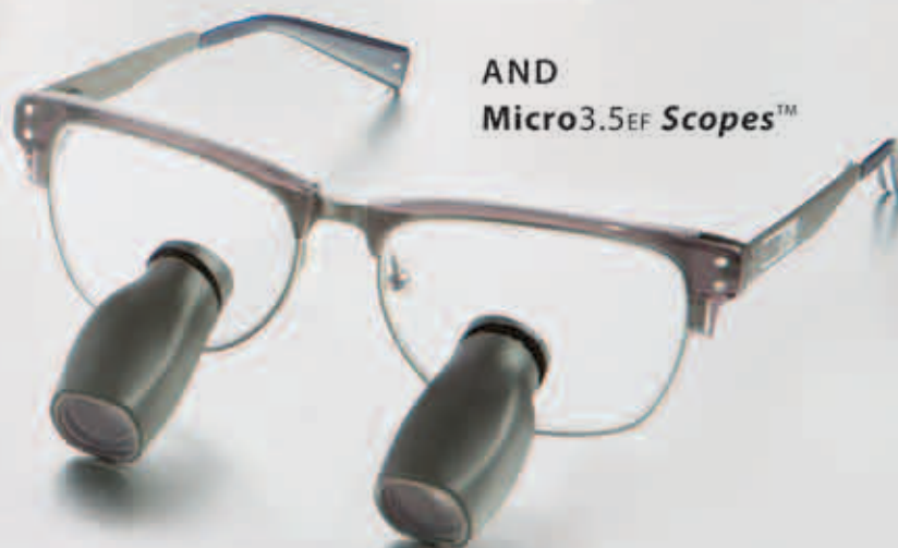
AND Micro3.5EF Scopes™