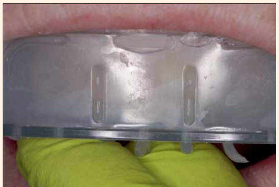
3. Impresión obturada con Structur 3 en el muñon dental, fase intraoral del curado.