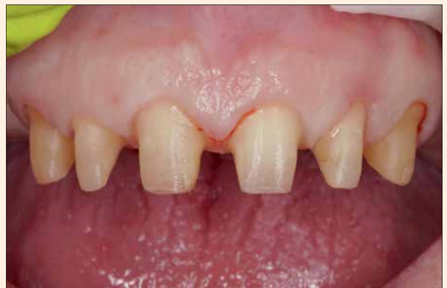
2. Muñones dentales preparados.