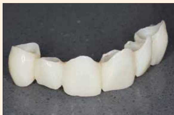
5. Puente provisional ya finalizado.