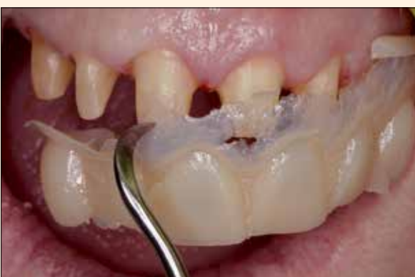
4. Remoción en la fase elástica para el curado extraoral.