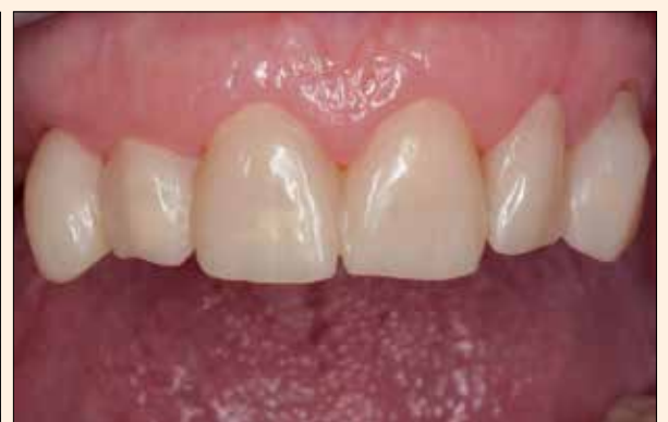
6. Resultado grato.