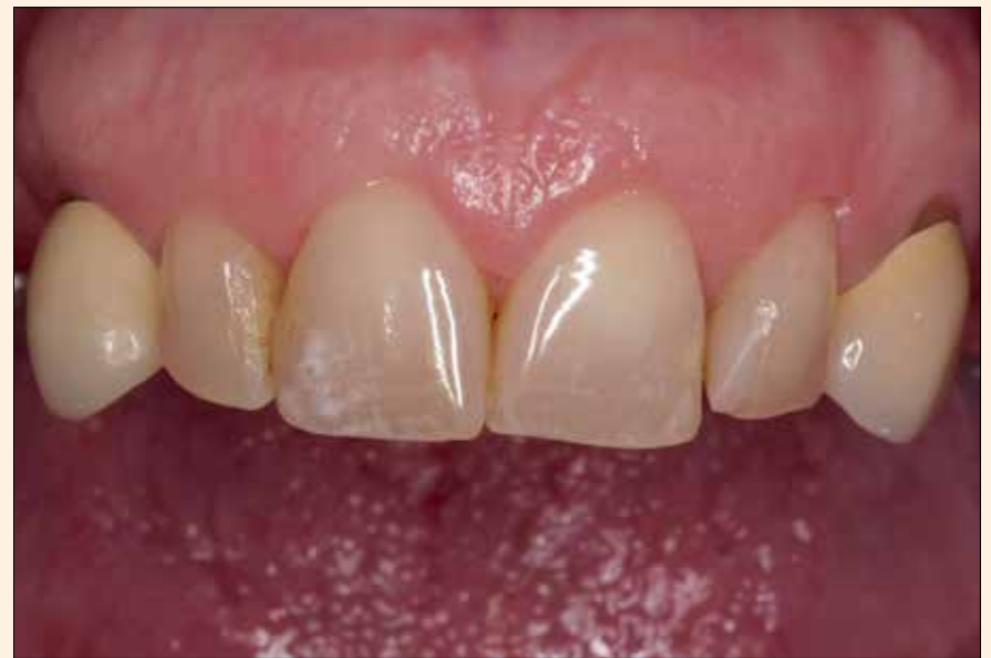
1. Situación inicial.